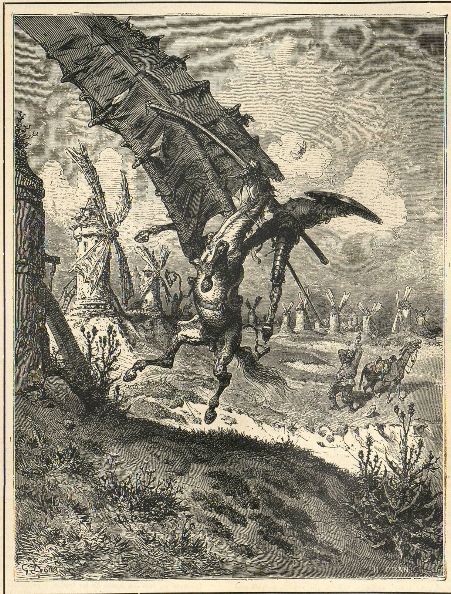
.....y dándole una lanzada en el aspa.....

—La vuestra ferrosura, señora mía, puede facer de su persona lo que más le valiera en talante, porque ya la soberbia de vuestros robadores yace por el suelo, derribada por este mi fuerte brazo. Y porque no penéis por saber el nombre de vuestro libertador, sabed que yo