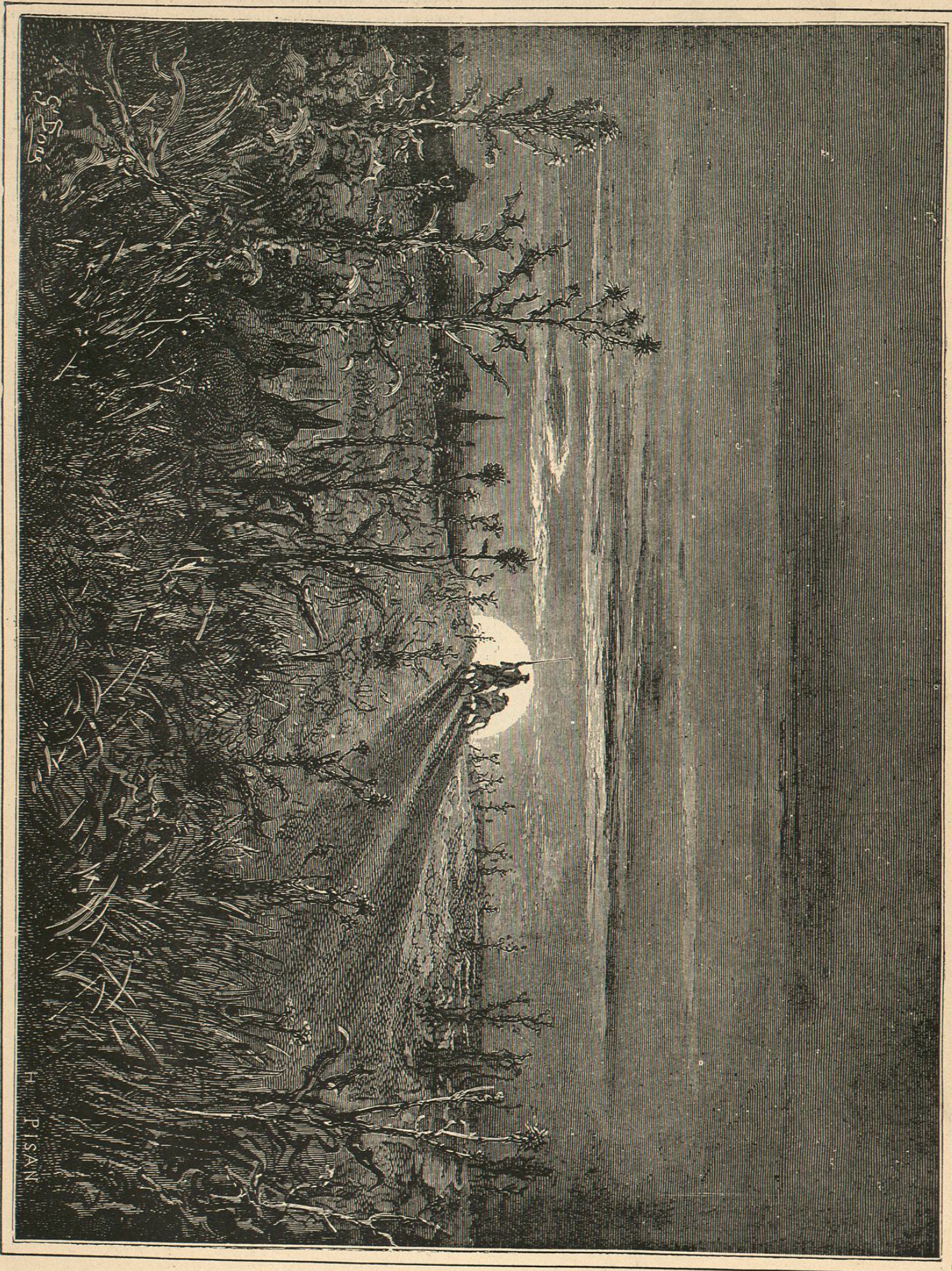
Al amanecer se pusieron en camino del Toboso.