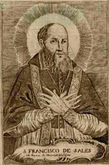
S. FRANCISCO DE SALES