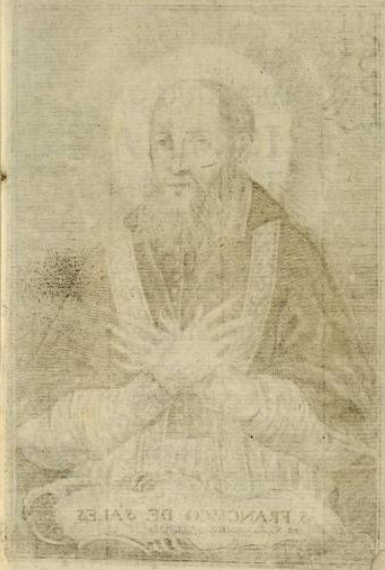
FRANCISCO DE SALES

UNIVERSIDAD DE NUEVO LEON Biblioteca Valverde y Tellez