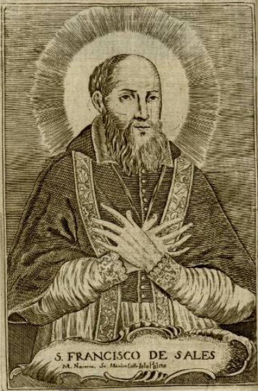
S. FRANCISCO DE SALES