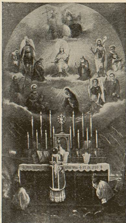
LA CAPILLA EXPIATORIA DEL SANTÍSIMO SACRAMENTO ESTÁ PUESTA BAJO LA INVOCACIÓN DE