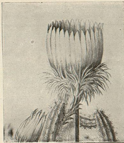
CEREUS GRANDIFLORUS (véase p. 239).