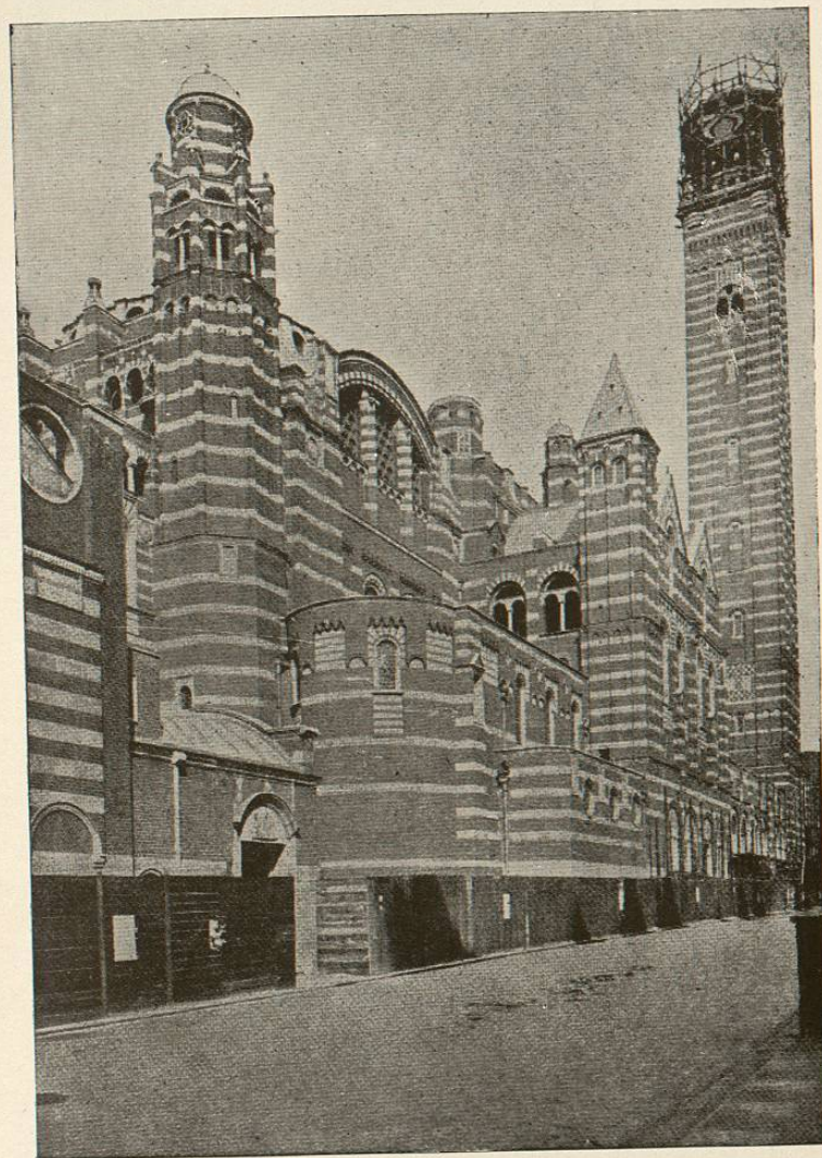
ABSIDE DE LA CAPILLA EXPIATORIA DEL SANTÍSIMO SACRAMENTO.

El Altar con su mesa baja y dosel suspendido será muy sencillo y su dorsal cubierto de loza de encarnado antiguo, embutido con mármol blanco y negro en la pared del ábside.