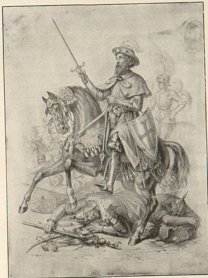
SANTIAGO EL APÓSTOL.

minster sea el Sion de donde, durante nuestra triste cautividad del Protestantismo, parta el incendio que envuelva á Inglaterra en el fuego del Amor del Santísimo Sacramento.