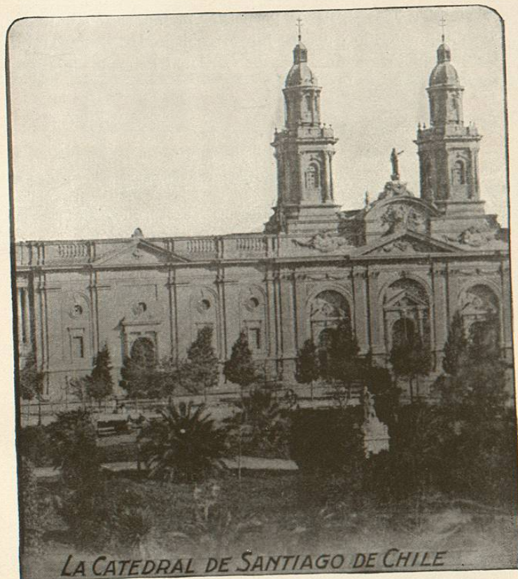
LA CATEDRAL DE SANTIAGO DE CHILE