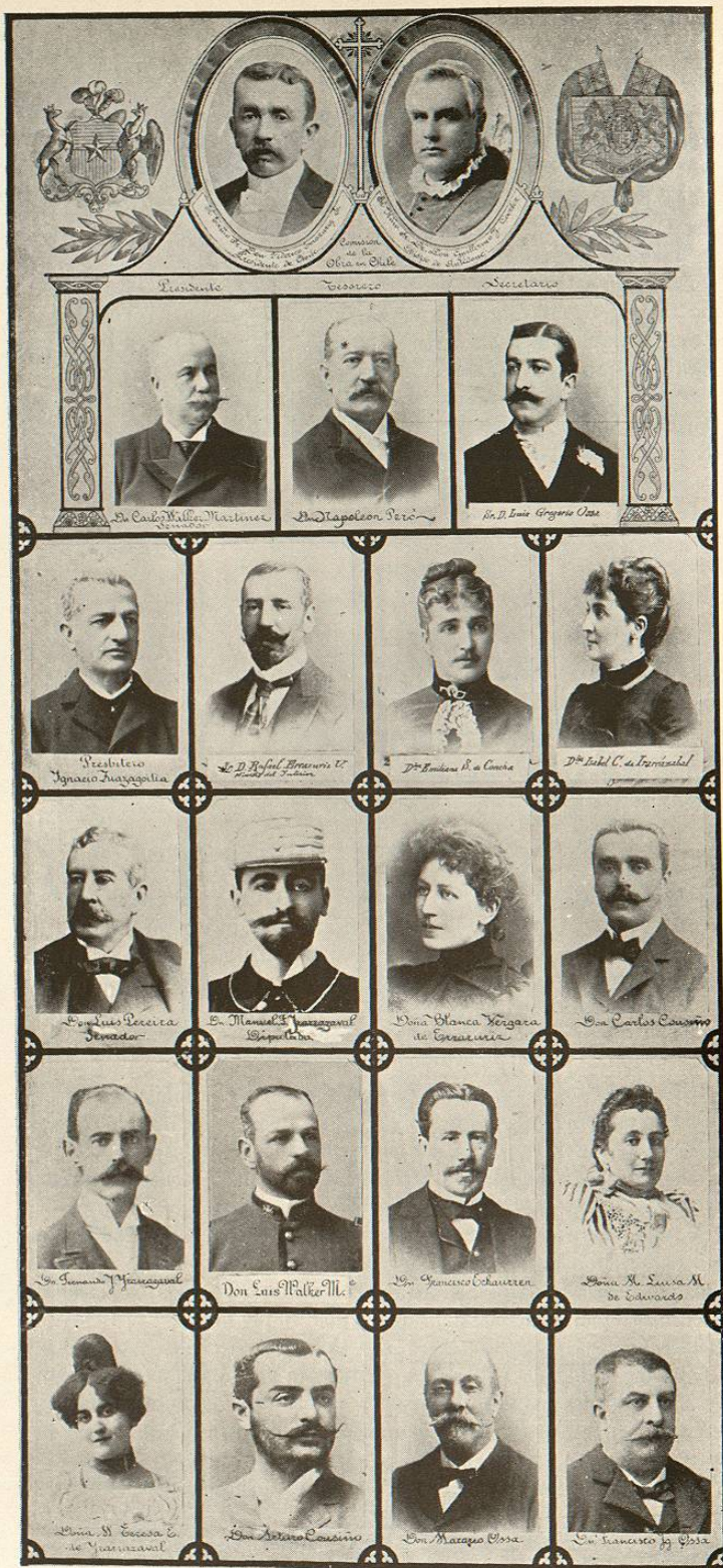
SOCIOS-FUNDADORES EN LA REPÚBLICA DE CHILE.