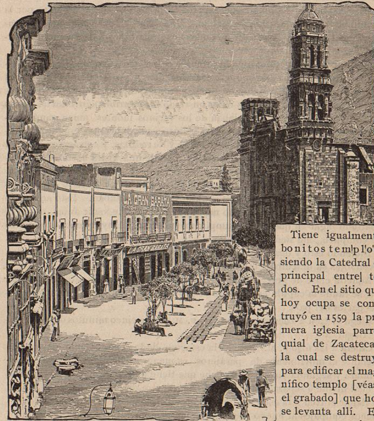
LA CATEDRAL.—Vista en la calle Aldama, Zacatecas.

Sus edificios principales son: El Palacio de Gobierno, el Palacio Municipal, la Casa de Moneda, el Palacio Legislativo, el Mercado Principal, que costó $300,000, y otros dedicados á la instrucción y beneficencia pública.