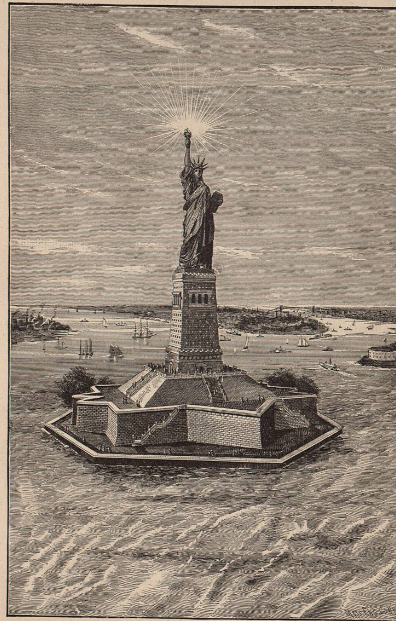
ESTATUA DE LA LIBERTAD—Nueva York.

ria. Dióse principio á la construcción del pedestal y la colocación de la estatua sobre él quedó al fin terminada. Su formal presentación á esta nación tuvo lugar el día 28 de Octubre de 1886, día que fué declarado festivo por el Mayor de la ciudad de Nueva York. Las ceremonias que acompañaron al acto de presentación fueron imponentes y el entusiasmo que reinó indescriptible.