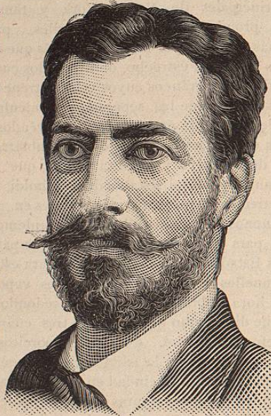
AUGUSTE F. BARTHOLDI.

Como para la erección debida de estatua tan colosal se necesitaban cimientos y un pedestal cuyo presupuesto de construcción ascendía á $300,000 se abrió en Nueva York otra suscripción para el efecto, pudiéndose reunir después de considerables demoras la cantidad necesi-