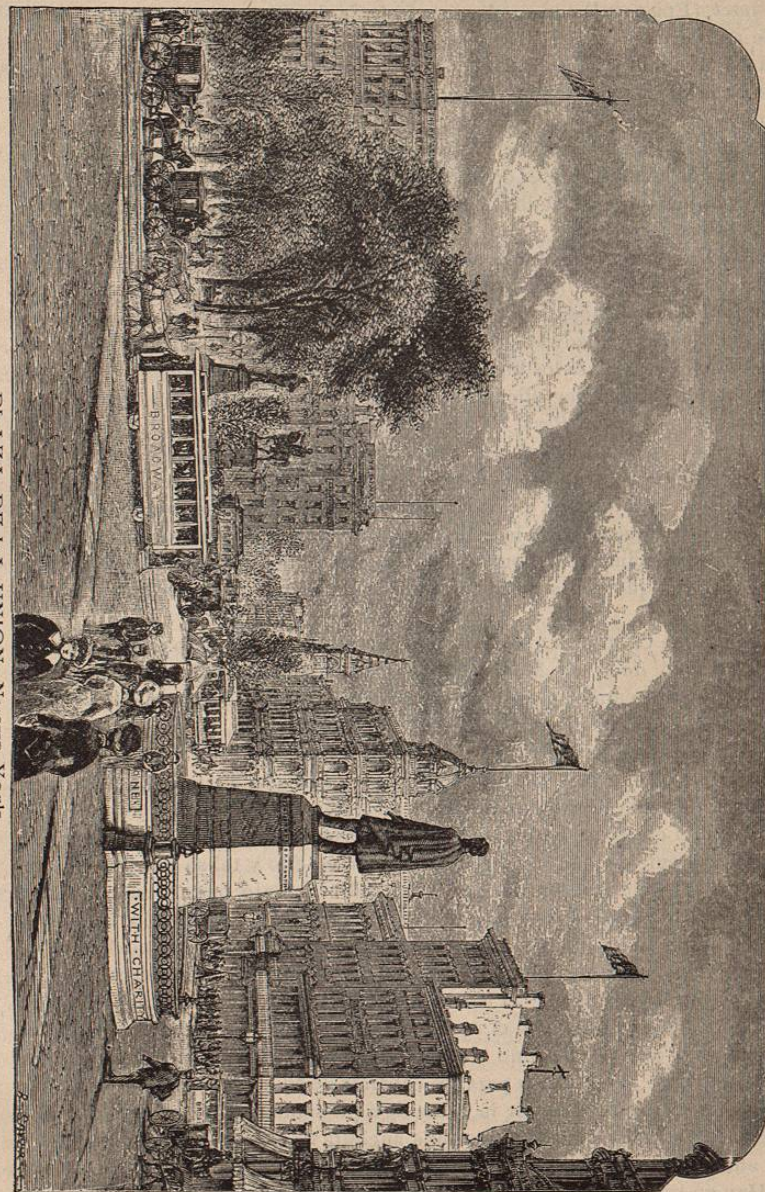
PLAZA DE LA UNION—Nueva York.

En la calle Broadway está tambien, esquina de la calle Chambers, el antiguo y vasto edificio que anteriormente ocuparon A. T. Stewart & Co., grandes comerciantes al por mayor. Se levanta éste en el mismo sitio donde los ingleses construyeron un fortin durante el período de la Revolucion. Más delante, siguiendo por la misma calle, se pasan al hermoso edificio de la New York Life Insurance Co. ; el Metropolitan Hotel , en cuyo piso principal se encuentra el Niblo's Garden ; el Gran Central Hotel ; la iglesia llamada Grace