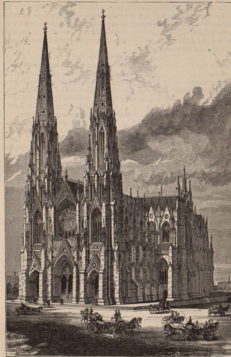
CATEDRAL DE SAN PATRICIO—Nueva York.

Jerome Park , situado como á 12 millas de la Casa de Correos. Es el principal y más aristocrático de cuantos hay en el país. Puede irse á este lugar por medio del ferrocarril elevado hasta el Río Harlem y de allí por tranvías hasta el lugar. También puede hacerse el viaje tomando uno de los