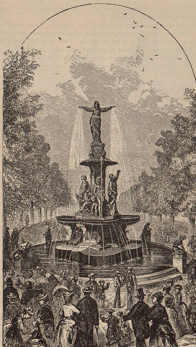
LA FUENTE DE TYLER DAVIDSON—Cincinnati, Ohio.

En la actualidad es una de las principales ciudades del país, con una poblacion de 275,000 almas. Su primer ferrocarril (Little Miami R. R.) se construyó en el año de 1850 y hoy forman una red las líneas férreas que allí convergen. Su aspecto general es simplemente hermoso; sus calles aseadas, bien empedradas y rectas forman cuadras rectangulares y lucen en su parte más activa tan sólidos y lujosos edificios como cualquier otra gran ciudad del país. Sus negocios se hallan en estado floreciente y la industria manufacturera forma su principal elemento de riqueza. Se fabrican aquí en grande escala botas, zapatos, ropa, muebles, carruajes, whiskey, cerveza, maquinaria y embarcaciones. El empaque de carnes de puerco es otra de las grandes industrias con que cuenta esta ciudad. Tiene un excelente sistema de tramvias eléctricas, de cable y movidas por caballos y su alumbrado