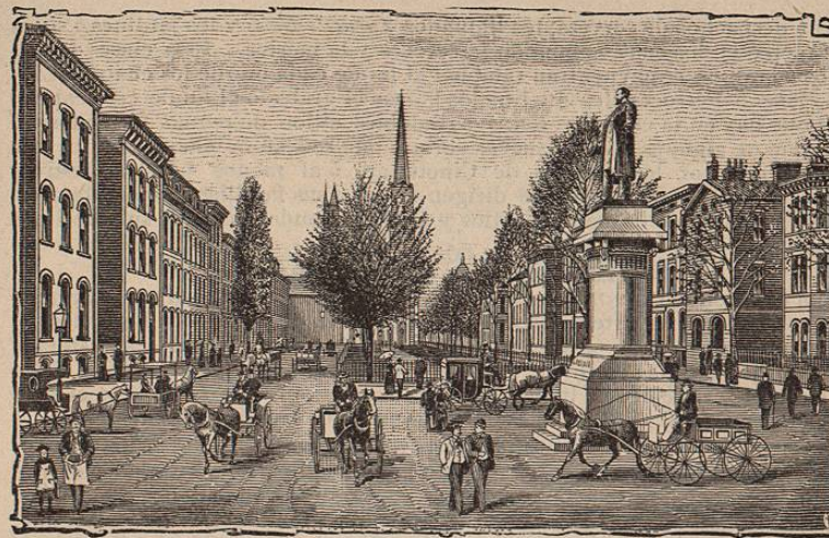
GARFIELD SQUARE—Cincinnati, Ohio.

En la calle 5 ª entre las de Vine y Walnut se encuentra la Fuente de Tyler-Davidson , [véase el grabado en la página 195] la cual ocupa el centro de una plazuela de forma ovalada que mide 400 piés de largo por 60 piés de ancho y que tiene pavimento de piedra, árboles y cómodos bancos de madera y hierro. En este sitio se levantaba anteriormente un antiquísimo mercado el cual se destruyó, gastando el ayuntamiento la suma de $75,000