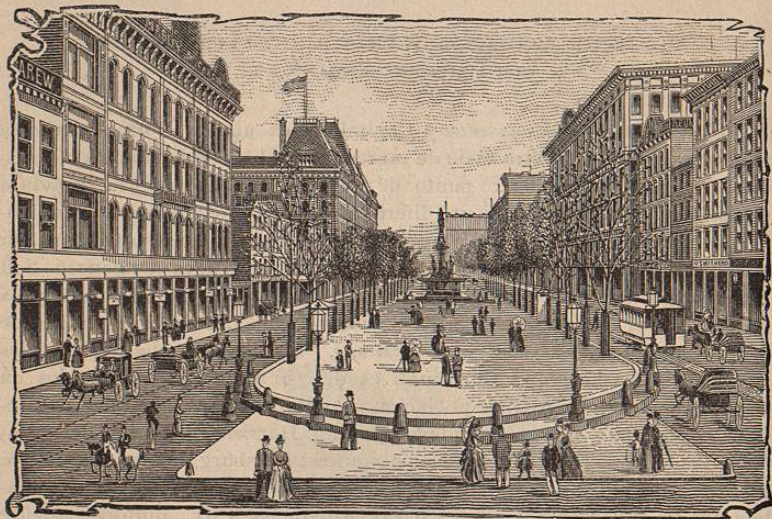
FOUNTAIN SQUARE—Cincinnati, Ohio.

impidiendo así su desarrollo. En 1816, sin embargo, Cincinnati construyó su primer vapor, hecho que resultó ser de importancia trascendental, no solo para la ciudad que nos ocupa sino también para las otras ciudades situadas en las vegas del Ohio y del caudaloso Misisipí, pues trasformó completamente el orden de navegacion fluvial que entre las referidas poblaciones se habia establecido. Cincinnati continuó de allí en adelante con empeño la construccion de vapores y estableció relaciones comerciales con todos los puntos de alguna importancia en el llamado Valle del Misisipí. Sus vapores comenzaron á surcar las aguas del Misisipí hasta Nueva Orleans, las aguas del Missouri y sus afluentes y las aguas, igualmente, del Ohio, con-