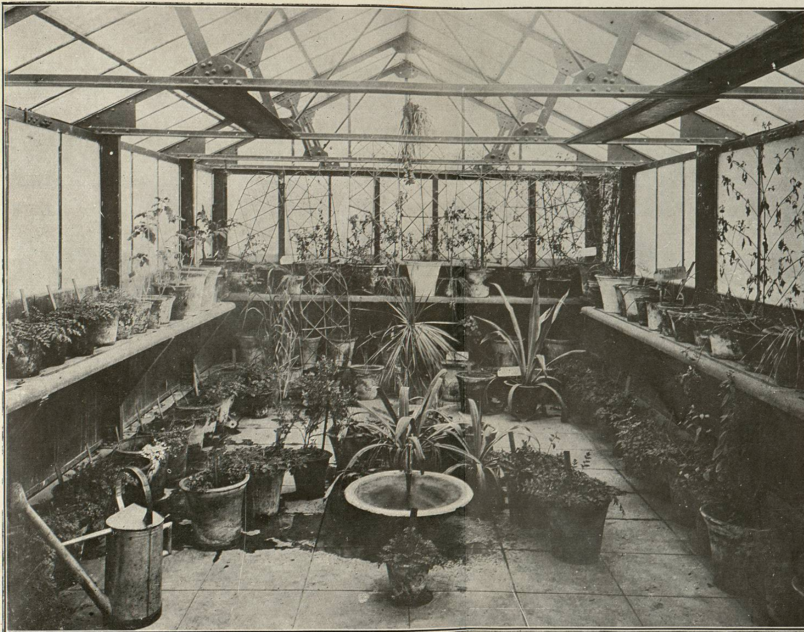
INVERNADERO DE LA COMISION DE PARASITOLOGIA AGRICOLA EN DONDE SE CULTIVAN LAS PLANTAS INSECTICIDAS.