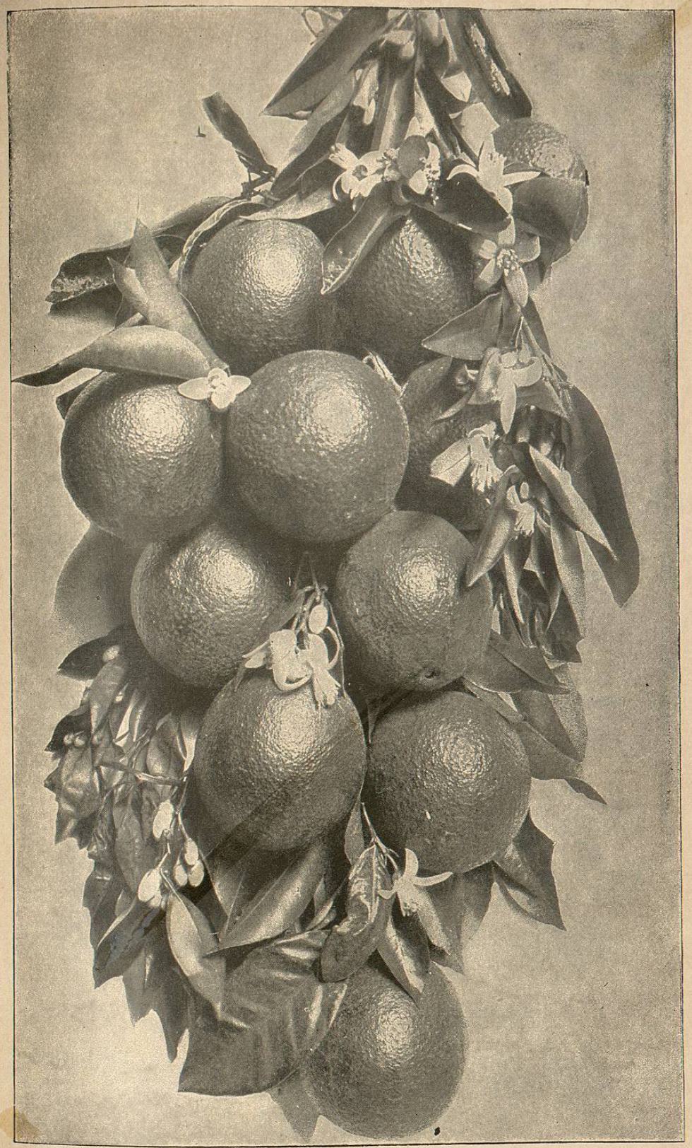
Fig. 1.—La naranja Navel de Washington. La reina de las naranjas (reducida).