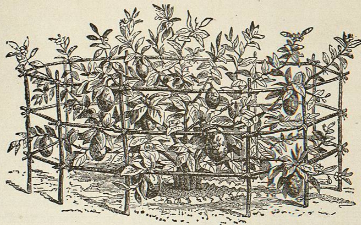
Fig. 123.—Método francés para proteger las ramas y frutas del limón.