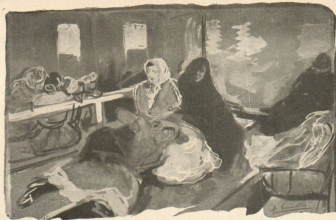
PRIMER BOCETO DEL CUADRO «TRATA DE BLANCAS»

En 1848 fué encargado de formar los itinerarios de Madrid á Andalucía; en 1851 el de Aranjuez á Talavera, y posteriormente otros varios. Formó parte de la división enviada á los Estados Pontificios en 1849. En 1860 fué nombrado jefe del Detall de la Comisión estadística del Reino, y en 1881 vocal de la Junta de defensa. En 1885 fué elegido senador por Guipúzcoa. Es académico de la Historia desde 1872. Su obra más notable es la magnífica Historia de la guerra de la Independencia , en catorce volúmenes, libro al que ha dedicado cuarenta años de prolijos y concienzudos estudios y que es un verdadero monumento. Muy hermosas y útiles son también sus demás obras, entre las que deben citarse la Geografía histórico-militar de España y Portugal , Un soldado español de veinte siglos , Nieblas de la historia patria , y las conferencias acerca de Hernán Cortés , Juan Martín el Empecinado , Fernando VII en Valençay , etc.