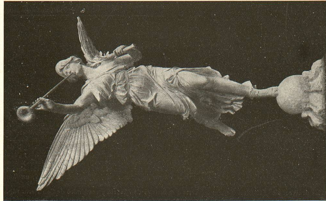
FAMA PARA EL MONUMENTO DE ALFONSO XII, POR RICARDO BELLVER

la fisiología y patología del niño. La mayoría de sus trabajos científicos, literarios y prácticos se ha dedicado á combatir la letal indiferencia con que en nuestro país se estiman los problemas relacionados con asunto tan importante como la vida infantil. Hombre generosísimo y talento preclaro, ha dedicado su actividad y los recursos con su trabajo conseguidos á la fundación del Sanatorio Marítimo de Chipiona, primera institución de esa clase existente en España; á conseguir que se redactara y aprobase la Ley de protección á la infancia, llamada Ley Tolosa Latour ; á librar de la muerte millares y millares de niños; y á escribir en favor de ellos, con castiza y elegante pluma, infinidad de libros, estudios y artículos admirables. Sus trabajos literarios los firma con el seudónimo El doctor Fausto . Es académico de Medicina desde 1899. Obras principales: La Madre y el Niño , revista de Higiene y Pediatría; Profilaxis de la difteria , Higiene del trabajo en la segunda infancia , El problema infantil , Niñerías , etc.