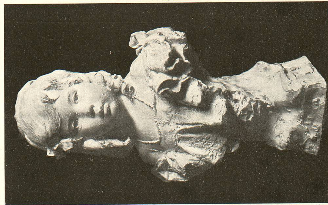
BUSTO DE NIÑA