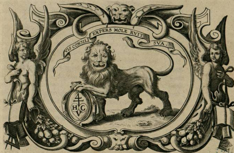
TABLA DE CEBES, PHILOSOFO PLATONICO.

EN AMBERES, Por la VIUDA de HENRICO VERDUSSEN.