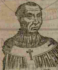
257. BENEDICTO XIV. Natural y arzobispo de Bolonia, llamado antes Próspero Lambertini, y conocido con este nombre en la multitud de obras que justamente le han adquirido el título de uno de los papas mas sabios que han ocupado la cátedra de San Pedro. Concluyó la célebre cuestion de los ritos Chinos que habia durado en la Iglesia mas de un siglo y fueron tantas sus disposiciones sobre disciplina eclesiástica, que puede llamarse el reformador de ella, para todo lo cual le ayudó mucho el dilatado tiempo en que sirvió los empleos de abogado consistorial, promotor de la fé, consultor del Santo Oficio, examinador de obispos y secretario de la congregacion del concilio, fué sumamente celoso por la propagacion de la fé y la reforma de las costumbres, muy limosnero con los pobres y peregrinos, muy devoto e incansable en el trabajo, pues aun poco antes de morir escribió una carta larga é interesante sobre los impedimentos del matrimonio, y despatchó diferentes negocios sobre beatificacion de algunos siervos de Dios, de los cuales canonizó y beatificó muchos durante su gobierno, dió nueva forma al gobierno de la ciudad en lo civil, administrativo y judicial, reglamentó el comercio en sus provincias, erigió nuevas cátedras para la instruccion de la juventud, enriqueció la biblioteca del Vaticano y los museos, amplió el hospital del Espíritu Santo en Roma, añadiendola un célebre cementerio. En una palabra, fué tan grande en el solio, como lo habia sido en sus escritos. Murió con suma edificacion á 3 de Mayo de 1758, de edad de 83 años. Gobernó 17 años y 8 meses.

Florentino, de la noble familia de los Corsinos: su pontificado ha sido uno de los mas pacíficos; edificó y reparó en Roma varios edificios públicos: canonizó á los santos Vicente de Paul, fundador de los padres de la mision y hermanas de la caridad, Juan Francisco Reges, célebre misionero jesuita del Vivarrais en Francia, y á las santas Juliana de Falconeris y Catalina Flisca Aduna: disminuyó los impuestos públicos, castigó á los que habian prevaricado en sus empleos bajo el pontificado precedente; y su gobierno en general fué muy sabio y prudente. Murió de la avanzada edad de 88 años, á 6 de Febrero de 1740. Gobernó 10 años, 6 meses y 21 dias.