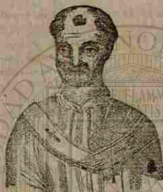
256. CLEMENTE XII. Florentino, de la noble familia de los Corsinos: su pontificado ha sido uno de los mas pacíficos; edificó y reparó en Roma varios edificios públicos: canonizó á los santos Vicente de Paul, fundador de los padres de la mision y hermanas de la caridad, Juan Francisco Reges, célebre misionero jesuita del Vivarrais en Francia, y á las santas Juliana de Falconeris y Catalina Flisca Aduna: disminuyó los impuestos públicos, castigó á los que habian prevaricado en sus empleos bajo el pontificado precedente; y su gobierno en general fué muy sabio y prudente. Murió de la avanzada edad de 88 años, á 6 de Febrero de 1740. Gobernó 10 años, 6 meses y 21 dias.