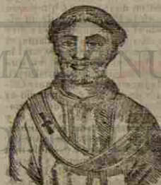
255. BENEDICTO XIII.

Romano. De la noble casa de Conti, llamado antes Miguel: electo el 8 de Mayo de 1721. disfrutó su consagración por diez días que tomó para prepararse: estableció la fiesta del Santísimo Nombre de Jesus que se celebra en toda la Iglesia, la Dominica segunda despues de Epifania: extendió igualmente á todas las diócesis católicas el oficio de S. Isidoro, obispo de Sevilla: beatificó al Beato Andrés de Cominibus, varón ilustre por su piedad y milagros, y cuyo culto, introducido desde el Siglo IV, se habia suspendido por un decreto pontificio posterior: introdujo con mucha recomendación la causa de canonización del V. Gregorio Barbado, obispo de Padua, ante la sagrada congregacion de Ritos: manifestó en fin, una gran integridad de costumbres, suma madurez en la expedición de los negocios en que se habia ejercitado en las diversas legacias servidas por él antes de su elevación al trono Pontificio. Murió á 7 de Marzo de 1724. Gobernó 2 años, 9 meses y 29 dias.