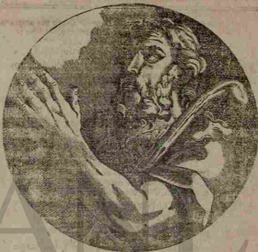
Moisés, Libertador del pueblo de Israel.

Nota.—Todos los cálculos astronómicos están arreglados al tiempo medio civil.