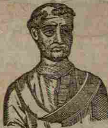
258. CLEMENTE XIII. Veneciano, llamado antes Carlos Rezzonico, obispo de Padua, introdujo en la misa el Prefacio de la Santísima Trinidad en todos los domingos que no la tuvieren propio, renovó el título de apostólico al rey de Hungría, y concedió indulto para comer carne en dias prohibidos á los ejercitos españoles; canonizó á los santos Juan Cancio, José Calazano, José Cupertino, Gerónimo Emiliano, Serafín de Monte Granaro y Juana Francisca Fremiot; lo que ha hecho mas célebre á este gran papa, fué la firmeza apostólica con que sostuvo la causa de la Iglesia en la cuestion de los jesuitas, espulsados con la mayor crueldad y calumniados atrocemente de los reinos de Portugal, España, Nápoles, Parma y otros y sobre todo en Francia donde la impiedad llegó á hacerla mas escrutiga calificacion del instituto de la Compañia de Jesus, aprobado por diez y nueve pontífices y proclamado piadoso por el concilio ecumenico de Trento, su famosa bula Apostolicum de 7 de Enero de 1764, sera siempre el título de mayor gloria para este gran papa, asi como el testimonio mas autentico de la inocencia de los jesuitas, la santidad de sus constituciones, la utilidad de sus ministerios y lo fructuoso de sus servicios á la Iglesia de Dios y á todas las naciones del orbe. Murió en 2 de Febrero de 1769. Gobernó 10 años, 6 meses y 26 dias.