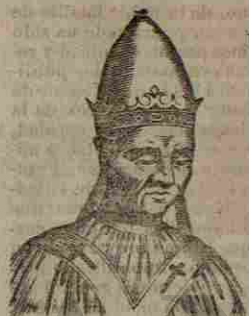
254. INOCENCIO XIII.

CONTINUA la breve noticia de los Simos Pontífices, con los ritos eclesiásticos que sucesivamente han ido estableciendo.