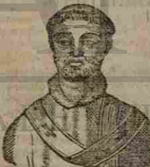
259. CLEMENTE XIV. Natural de Urbino, llamado antes Lorenzo Gaucanelli, religioso que habia sido de San Francisco; su carácter conciliador le acarreó no pocas pesadumbres de parte de los ministros de las cortes borbónicas, encarnizadas furiosamente contra la Compañia de Jesus y fascinadas por las doctrinas regalistas, recobró los ducados de Avignon y Benevento usurpados á su antecesor, suprimió la lectura de la famosa bula de la Cena, que se hacia los jueves santos en Roma aunque sin derogarla, como lo prueban los testigos; canonizó á S. Francisco Caracciolo, San Benito de Palermo, Santa Angela Mellica, Sta. Coleta y Sta. Jacinta Maraschi; condenó muchas obras de los filósofos modernos, entre ellas las de Voltaire. Despues de cuatro años de terribles ataques de las cortes borbónicas, dió el célebre breve de abolicion de la compañía de Jesus á 21 de Julio de 1773, con grande gozo del partido filosófico é impio, suma tristeza y dolor de todo el catolicismo y afliccion del infortunado papa, que continuamente clamaba haberlo firmado compulsado por la fuerza. Sin embargo ese breve, que fué resistido por el episcopado frances dejó inmune la santidad del instituto y sin nota alguna las personas de los perseguidos jesuitas, que fueron conservados por el mismo Papa en Frusia y en la parte de Polonia agregada á la Rusia. En sus ultimos momentos fué asistido milagrosamente por S. Alfonso Ligorio. Las caritas atribuidas á este Papa por Caracciolo, han sido convencidas de apócrifas, asi como de falsa su muerte por su envenenamiento. Murió en 24 de Setiembre de 1774. Gobernó 5 años, 1 mes y 3 dias.

Veneciano, llamado antes Carlos Rezzonico, obispo de Padua, introdujo en la misa el Prefacio de la Santísima Trinidad en todos los domingos que no la tuvieren propio, renovó el título de apostólico al rey de Hungría, y concedió indulto para comer carne en dias prohibidos á los ejercitos españoles; canonizó á los santos Juan Cancio, José Calazano, José Cupertino, Gerónimo Emiliano, Serafín de Monte Granaro y Juana Francisca Fremiot; lo que ha hecho mas célebre á este gran papa, fué la firmeza apostólica con que sostuvo la causa de la Iglesia en la cuestion de los jesuitas, espulsados con la mayor crueldad y calumniados atrocemente de los reinos de Portugal, España, Nápoles, Parma y otros y sobre todo en Francia donde la impiedad llegó á hacerla mas escrutiga calificacion del instituto de la Compañia de Jesus, aprobado por diez y nueve pontífices y proclamado piadoso por el concilio ecumenico de Trento, su famosa bula Apostolicum de 7 de Enero de 1764, sera siempre el título de mayor gloria para este gran papa, asi como el testimonio mas autentico de la inocencia de los jesuitas, la santidad de sus constituciones, la utilidad de sus ministerios y lo fructuoso de sus servicios á la Iglesia de Dios y á todas las naciones del orbe. Murió en 2 de Febrero de 1769. Gobernó 10 años, 6 meses y 26 dias.