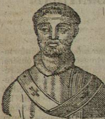
259. CLEMENTE XIV. Natural de Urbino, llamado antes Lorenzo Ganganelli, religioso que habia sido de San Francisco; su carácter conciliador le acarrió no pocas pesadumbres de parte de los ministros de las cortes borbónicas, encarnizadas furiosamente contra la Compañia de Jesus y fascinadas por las doctrinas regalistas, recobró los ducados de Avinion y Benevento usurpados á su antecesor, suprimió la lectura de la famosa bula de la Cena, que se hacia los jueves santos en Roma, aunque sin derogarla, como lo prueba los teólogos: canonizó á S. Francisco Caracciolo, San Benito de Palermo, Santa Angela Melicia, Sta. Coleta y Sta. Jacinta Mareschoti: condenó muchas obras de los filósofos modernos, entre ellas las de Voltaire. Despues de cuatro años de terribles ataques de las cortes borbónicas, dió el celebre breve de abolicion de la compañía de Jesus á 21 de Julio de 1773, con grande gozo del partido filosófico é impio, suma tristeza y dolor de todo el catolicismo y afliccion del infortunado papa, que continuamente clamaba haberlo firmado compulsado por la fuerza. Sin embargo ese breve, que fué resistido por el episcopado frances dejó inmune la santidad del instituto y sin nota alguna las personas de los perseguidos jesuitas, que fueron conservados por el mismo Papa en Frusia y en la parte de Polonia agregada á la Rusia. En sus ultimos momentos fué asistido milagrosamente por S. Alfonso Ligorio. Las cartas atribuidas á este Papa por Caracciolo, han sido convencidas de apócrifas, asi como de falsa su muerte por envenenamiento. Murió en 22 de Setiembre de 1774. Gobernó 5 años, 4 meses y 3 dias.