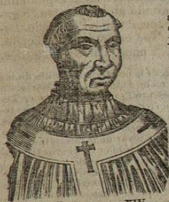
257. BENEDICTO XIV. Natural y arzobispo de Bolonia, llamado antes Próspero Lambertini, y conocido con este nombre en la multitud de obras que justamente le han adquirido el título de uno de los papas mas sábios que han ocupado la cátedra de San Pedro. Concluyó la célebre cuestion de los ritos Chinos que habia durado en la Iglesia mas de un siglo y fueron tantas sus disposiciones sobre disciplina eclesiástica, que pue le llamarse el reformador de ella, para todo lo cual le ayudó mucho el dilatado tiempo en que sirvió los empleos de abogado consistorial, promotor de la fé, consultor del Santo Oficio, examinador de obispos y secretario de la congregacion del concilio, fué sumamente celoso por la propagacion de la fé y la reforma de las costumbres, muy limosnero con los pobres y peregrinos, muy devoto é incansable en el trabajo, pues aun poco antes de morir escribió una carta larga é interesante sobre los impedimentos del matrimonio, y despachó diferentes negocios sobre beatificacion de algunos siervos de Dios de los cuales canonizó y beatificó muchos durante su gobierno, dió nueva forma al gobierno de la ciudad en lo civil, administrativo y judicial, reglamentó el comercio en sus provincias, erigió nuevas cátedras para la instruccion de la juventud, enriqueció la biblioteca del Vaticano y los museos, amplió el hospital del Espíritu Santo en Roma, añadiendole un excelente cementerio. En una palabra, fué tan grande en el solio, como lo habia sido en sus escritos. Murió con suma edificacion á 3 de Mayo de 1758, de edad de 88 años. Gobernó 17 años y 8 meses.