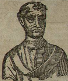
258. CLEMENTE XIII. Veneciano, llamado antes Carlos Rezzonico, obispo de Padua, introdujo en la misa el Prefacio de la Santísima Trinidad en todos los domingos que no lo tuviesen propio, renovó el título de apostólico al rey de Hungria, y concedió indulto para comer carne en dias prohibidos á los ejércitos españoles: canonizó á los santos Juan Cancio, José Calazano, José Cupertino, Gerónimo Emiliano, Serafín de Monte Granaro y Juana Francisca Fremiot: lo que ha hecho mas célebre á este gran papa, fué la firmeza apostólica con que sostuvo la causa de la Iglesia en la cuestion de los jesuitas, espulsados con la mayor iniquidad y calumniados atrozmente de los reinos de Portugal, España, Nápoles, Parma y otros y sobre todo en Francia donde la impiedad llegó á hacerla mas sacrilega calificacion del instituto de la Compañia de Jesus, aprobado por diez y nueve pontífices y proclamado piadoso por el concilio ecuménico de Trento, su famosa bula Apostolicum de 7 de Enero de 1764, sera siempre el título de mayor gloria para este gran papa, asi como el testimonio mas auténtico de la inocencia de los jesuitas, la santidad de sus constituciones, la utilidad de sus ministerios y lo fructuoso de sus servicios á la Iglesia de Dios y á todas las naciones del orbe. Murió en 2 de Febrero de 1769. Gobernó 10 años, 6 meses y 25 dias.