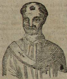
256. CLEMENTE XII. Florentino, de la noble familia de los Corsinos: su pontificado ha sido uno de los mas pacíficos; edificó y reparó en Roma varios edificios públicos: canonizó á los santos Vicente de Paul, fundador de los padres de la mision y hermanas de la caridad, Juan Francisco Reges, célebre misionero jesuita del Vivarrais en Francia, y á las santas Juliana de Falconeris y Catalina Flisca Aduna: disminuyó los impuestos públicos, castigó á los que habian prevaricado en sus empleos bajo el pontificado precedente; y su gobierno en general fué muy sábio y prudente. Murió de la avanzada edad de 88 años, á 6 de Febrero de 1740. Gobernó 10 años, 6 meses y 21 dias.