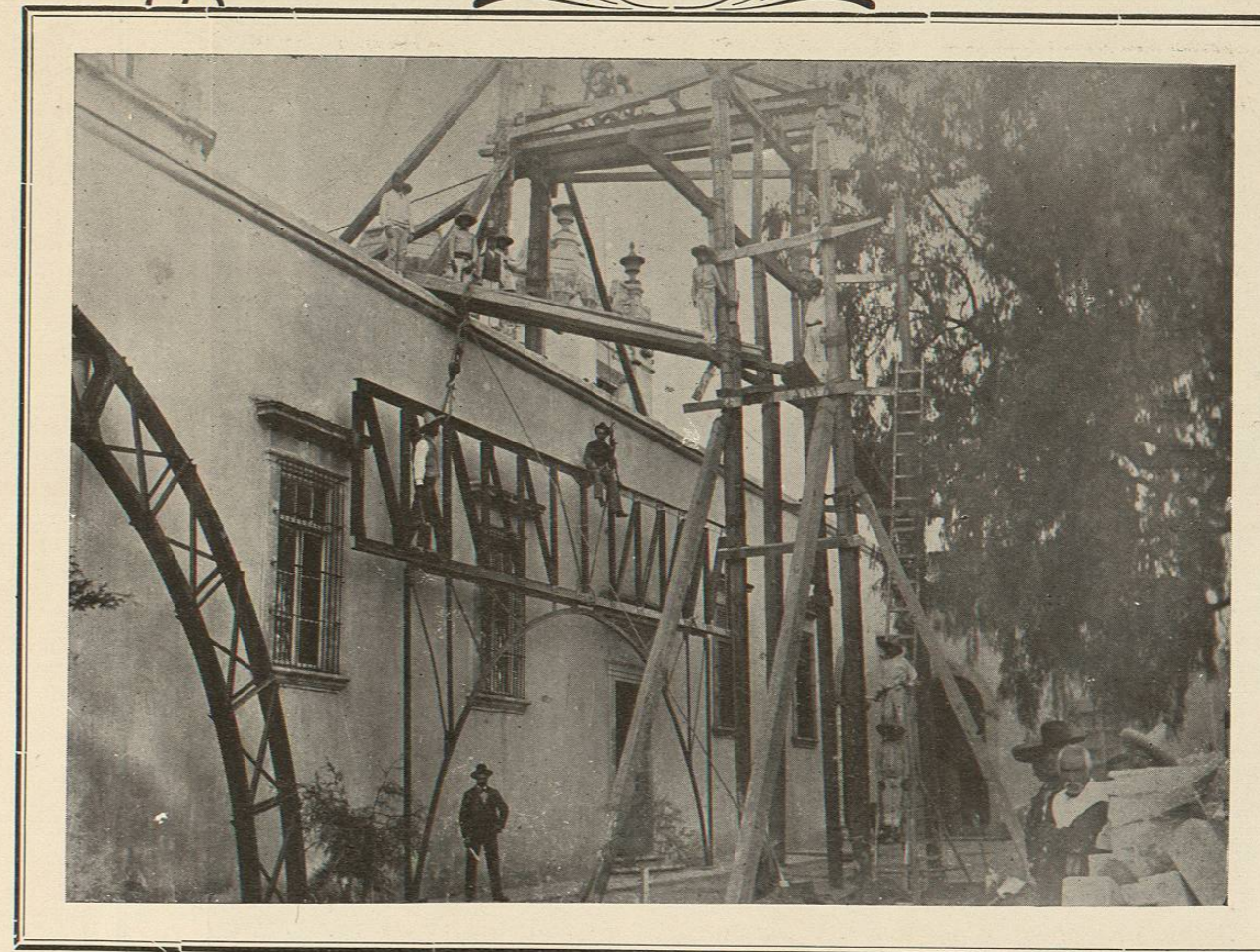
Vista de uno de los cuatro puentes de acero, de quince metros de largo, que fueron colocados para recibir la cúpula del Camarín de la Catedral de León.