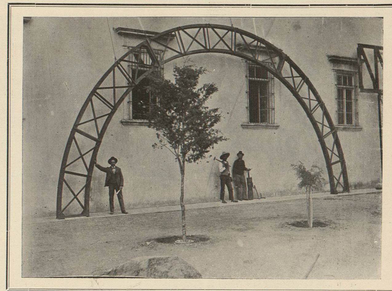
Arco de acero de catorce metros de diámetro, que se colocó debajo de los puentes que sostienen la cúpula del Camarín de la Catedral de León.

En este día, también por la tarde, hicieron su peregrinación los abundantes ramos de zapatería con la Asociación de San Crispín, y fábrica "El Elefante," y además los de jaricia, peletería, rebocería, hortalizas, tocinerías, albañiles y canteros. Hay que advertir que en el mes de Mayo, cada uno de estos ramos, como los del día anterior, hacen de por sí muy buenas funciones, y que por lo mismo, ahora