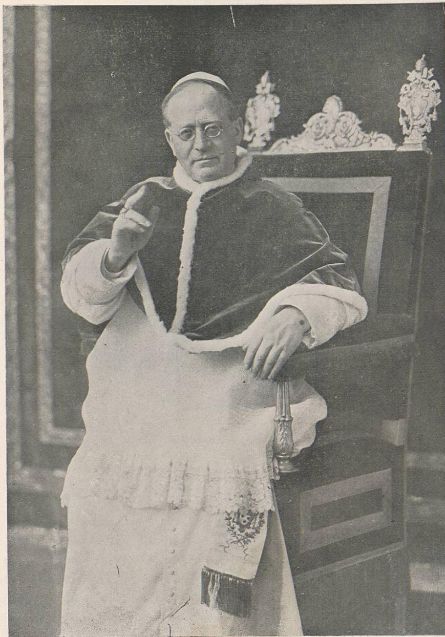
S. S. EL PAPA PIO XI.