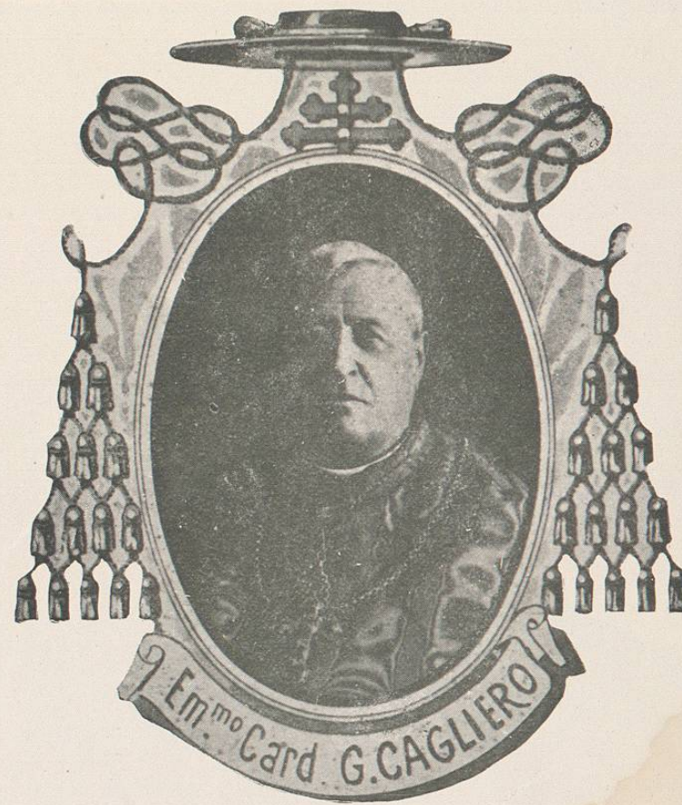
S. E. el Cardenal JUAN CAGLIERO, Salesiano.

Habiéndonos tú comunicado la noticia del vigésimo quinto aniversario de la fundación de ese Colegio, y habiendo solicitado nuestra Bendición y la del S. Padre Pío XI, tenemos sumo gusto en concedérsela y por especial autorización os comunicamos la Apostólica y Paterna Bendición del Padre Común y Vicario de Jesucristo, nuestro amadísimo Papa Pío XI.