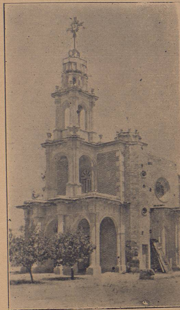
Capilla del Señor de la Misericordia.