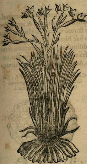
De ÇACATLEPATLI. Cap. XXVII.

C ACATLEPATLIS, quam alij Tetlacian, seu vrentem medicinam vocant, herba est folia proferens Hordei, Graminisq; , flores luteos, calycibus contectos, ac semen exile, & rotundum, radicesq; multas Aphodelo, similes. Nascitur in frigidis locis, qualis est Huesorzinum, & Xalailanum. Radices calci additas, aiunt vetustis vlcibus egregiè mederi, sed præcipuè his, quæ fauorum more multis scatent osculis. dilatatis namque plagis, atque exteris, tandem eo vitio affecti, sanitati restituantur. strumas etiam sanare impositas felici semper euentu, tumores præter naturam rumpere, atque patefacere, curare lychenas, & integram (si opus sit) carnem corrodere, & excauare. calida enim est ordine quarto, & vrenti natura, vnde euenit nomen.