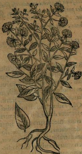
De YZTACPATLI Tgualapensi. Cap. XXV.

H ERBA YZTACPATLIS Tgualapensis radici insistit fibrata, vnde profert supites tenues, teretesq; , ornatos folijs Ocyimi, circinatis, & sublaeis floribus in pappum abeuntibus. Nascitur in calidis, planisq; , & humidis locis regionis Tgualapensis. Radix est acris, nonnihil amara, calidaq; , & sicca ordine quarto. folia vncie vnius pondere deuorata; aut decoctarum radicum Ius, ventris dolorem sedant, & pellunt lumbricos.