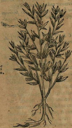
Herba Francisci Zimbren.

Y ZTACPATLIS ATOTONILCI herba est, folia proferens Lini, argentea, longiuscula, & angusta. caules sesquidrantem longos, teretes, lignosos, subalbidos. flores, vt dicunt, modicos, & candentes, ac radices surculosas. Nascitur apud Atotonilcenses, aridis planisq; , ac frigidis locis. vbi ea Franciscus quidam Zimbren, à quo etiam habet nomen, passim vitur, reputans mirabile pharmacum, & reliquorum, quæ apud Indos inuenta adhuc sunt, præstantissimum. calida namque est, & sicca ordine ferè quarto, odoraq; . Radix semiuncie pondere teritur, & redigitur in spherulam, mox resoluitur ex vino, & bis, teruè pereolarur, ac bibitur succus, qui corpus citra vllam noxam, aut laborem affitum euacuat.