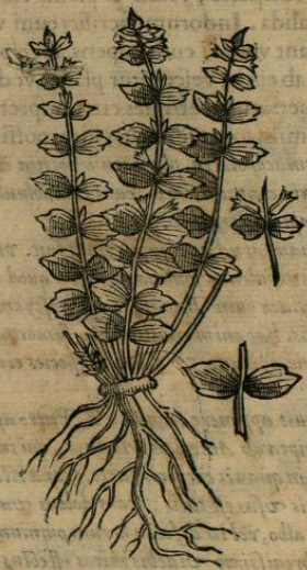
De TLALATOCHICTL, seu humili Pulegio. Cap. XVI.

H ERBA est Poztecpatl folia ferens Rutæ, candida, pusilla, conuoluta, ac arborum erumpentibus gemmis similia, quæ toto anno seruat, ac Nasturcium indistincta similitudine sapiunt. caules lignolos, & fascos, ac radices tenues, fibris similes. Nascitur saxosis locis, & asperis montium fragminibus, regionis Huaxacensis. caules & folia, calida & sicca, ordine quarto natura constant. eadem tusa, & drachmæ vnius pondere deuorata, succurrunt neruis, tendonibusq;, aut resolutis aut conuulsis, modo à frigida, & humida euenerit causa, ac amissum restituunt motum. quod est per multis cognitum experimentis.