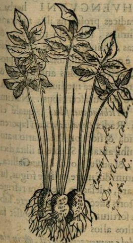
De TVZPATLI. Cap. XVIII.

Folium cordis simile aliquo modo, latitudinem habet trium digitorum. Herba porò ipsa forte Apocyno adiungi poterit, quod ex fructu, si eam Author descripsisset, facile conijci potuisset. folia bina ex aduerso posita, & sapor ille acris, ad hanc suspicionem aliquem possunt mouere.