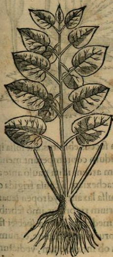
De AXIXCOÇAHVIZPATLI, seu medicina vrinae lutea. Cap. XXIIIX.

H ERBA est Axixcoçahvizpatlis folia ferens infernè lutea, vnde nomen, scutorum, aut Hederæ forma, multisq; distincta interuenijs. caules teretes, longos, lignosos. radicem verò breuem, crassiusculam, fibratam. Nascitur in collibus frigidarum regionum, campestribusq; , locis Tanguilani Mistecæ superioris. Radix est odorata gustu, acris, calidaq; , & sicca ordine tertio, subtiliumq; partium. vrinam euocat, & dolores renum tollit Ius decocti foliorum, semel quotidie tempore matutino epotatum.