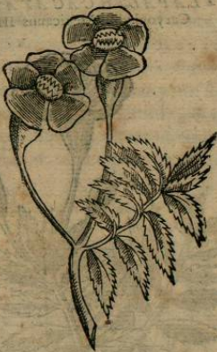
TEPECENPOAL XOCHITL. Caryoph. Mexic. VII.