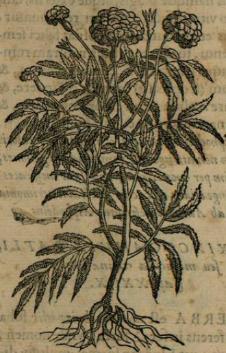
CEMPOALXOCHITL Caryophylli Mexicani planta.