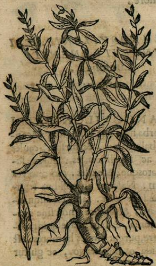
De ELOQVILTIC herba Geniculata. Cap. LII.

C HILPANXOCHITL, ab alijs Micaxochitl , seu Mortuorum medicina nuncupata, herba est, folia Salicis ferens, angustiora tamen, & tenuiora. caules cubitales. flores coccineos in postremis caulibus, qui rubri quoque sunt, calyculorum forma, aut signa, ut dictum est, referentes. radicem verò parvam, fibris candidis, & teretibus plenam. Radix est nonnihil amara, & tamen frigida esse naturæ experimento compertum est: febrim etiam extinguere ex aqua opportunè potam drachmarum trium, aut plurium, si opus est, pondere, inflammationes mammarum auertere, & epilepticis opitulari illitam, vnde secundum nomen.