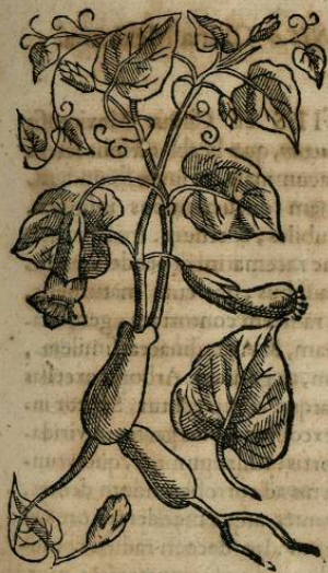
De TEPEHOILA CAPITXOCHITL , seu Hoila capitxochitl Saxiuoluula. Cap. LIII.

V OLVBILIS genus est Tepehoila capitxochitl , quod alij Tzic Micapaltis nuncupant, saxis se conuoluens. folia sunt Hederae. radix succo manat. Duo sunt eius genera eadem facultate prædita, sed primum, ut diximus, habet folia Hederae, Vrticavè similia, serrata; secundum verò scutorum potius undulatorum forma. Nascitur vtraque apud Mexicenses agros. frigidaque, & humentis est temperiei, quamvis nonnullam amaritudinem participare videatur, partesq; natura dissimiles. Vtuntur ea Indi aduersus calorem, & ad tumores præter naturam repellendos. necnon ad compescendum sanguinem qui è vulneribus fluit, & curandos oculos inflammatione tentatos. præcipuè si misceatur Toloztzin .