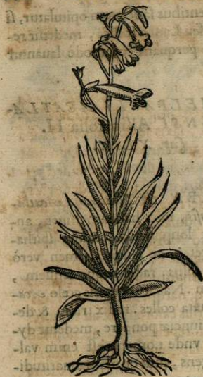
De CHILPANXOCHITL , seu flore signi instar pendenti Mortuorum medicina. Cap. L I.

C HILPANXOCHITL, ab alijs Micaxochitl , seu Mortuorum medicina nuncupata, herba est, folia Salicis ferens, angustiora tamen, & tenuiora. caules cubitales. flores coccineos in postremis caulibus, qui rubri quoque sunt, calyculorum forma, aut signa, ut dictum est, referentes. radicem verò parvam, fibris candidis, & teretibus plenam. Radix est nonnihil amara, & tamen frigida esse naturæ experimento compertum est: febrim etiam extinguere ex aqua opportunè potam drachmarum trium, aut plurium, si opus est, pondere, inflammationes mammarum auertere, & epilepticis opitulari illitam, vnde secundum nomen.