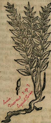
De AHOATON , sine Quercu parua. Cap. LIV.

A HOATON, seu Quercus parua, quam alij Tlalcapolin , seu Capolin humilem vocant, herba est, folia ferens Origanis, serrata, Chamædriosvè, aut Ilicis, minora tamen, vnde nomen, quæ inferna parte dilutiore virore nitent, supra verò exaturatiore. stipites rubrescentes, è radice longa, & fibrata, fulua, ac mediocris crassitudinis. flores coccineos, paruos, & longiusculos. acinos primò virides, mox rubeos, ac demum nigri coloris, nucleos fuluos continentes. Radix sapore est adstringenti, & aliquantisper amaro, non sine quadam dulcedine, odore nullo, frigidaque, & exiccanti natura. quæ si vnciarum trium mensura coquatur, è tribus libris aquæ fontanæ ad tertias, & ius decocti potandum propinetur, vice potus, enixas corroborat, dysenterias compescit, laxatas renum partes confirmat, & acoporum medicamentorum more, labores sedat eorum qui lassitudinem ex longo itinere, cursu, lucta, aut quavis alia simili occasione contraxerunt. Temperatas amat regiones, qualis est Tenuchitlana , frigidaque, & saxosa loca, atque montosa.