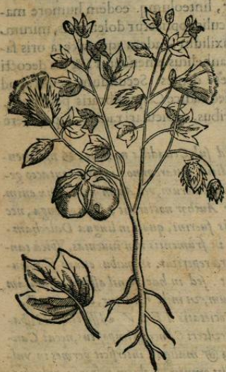
De TCHCAXIHVITL, seu Gossipio. Cap. LXXII.

H ERBA est Cacatzin folia Mali Punicæ proferens, sed longè maiora. caules purpureos, ac fructum orbicularem cicere maiorem. Radicem verò fibratam. Nascitur in iugis arborum expertibus, regionum frigidarum, quale est oppidum Tlilyquitepece Tlaxcaltecarum, vbi in maximo habetur ab indigenis pretio, putantibus incolumes ab omnium morborum iniurijs degere, ob eius herbae copiam. Cortex namque radice redactus in puluerem, ac duarum drachmarum pondere deuoratus, aluum leniter, ac citra noxam vllam subducit.