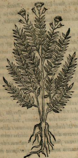
De ALAHVACAPATLI LEPTOPHYLLO. seu Lubrico, & tenui folio medicamento. Cap. LII.

H ERBA est Alahuacapatli , folia fundens tenuia, Lini familia, sed minora. flores candentes. radicem verò albam, pellucidam, fibratam, atque contortam. Nascitur regionibus frigidis Taualiuhcani , iuxta accliuia montium loca. Radix trita, & semiuncia pondere, ex aqua Buglossi, aut fontana deuorata, humores omnes vacuat. Est & alia Alahuacapatli spinifera, quæ ad Tunarum species est referenda, de qua suo loco tractabitur.