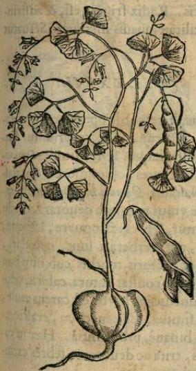
De XICAMA. Cap. LXXIV.

H ERBA est Xicama vocata, volubilis, quam Mexicanes Carzot, seu radicem succo manantem, vocant, radice crassæ, in orbicularem formam magna ex parte vergentis, candidæ. grati nutriti, & impensè refrigerantis temperiei. vnde prodeunt rami tenues, teretes, longi, & per terram sparsi. è quorum singulis per longa interualla, terna oriuntur folia, composita in modum crucis, ac veluti per medium orbiculariter secta. filiquæ etiam mediocres, quibusdam infartè lenticibus. Vbiq. prouenit, sed præcipuè hortensibus locis, sata atque exulta. Vfus est radicem, vt quæ in mensas postremas subinde veniant, gratamque, & frigentem, & flatui generando aptam, præbeant æstuantibus alimoniam. neque admodum malam, si prius aliquandiu pendeant perflabili loco, ac permittantur ibi emarcescere. Sitim eadem extinguunt, linguæ calori, & siccitati aduersantur, febricitantibus peropportunum alimentum præstant, corporaq. refrigerant, humectant, & alunt. Saccharo conditas aliquando audio radices, aut arena obrutas, delatas fuisse in Hispanias, nec priusquam eò peruenirent vitium aliquod contraxisse.