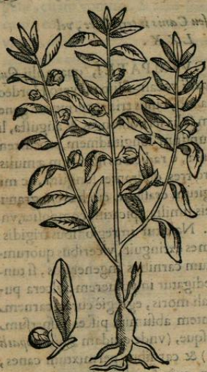
De CACATZIN, seu parua ÇACATL. Cap. LXXI.

H ERBA est Cacatzin folia Mali Punicæ proferens, sed longè maiora. caules purpureos, ac fructum orbicularem cicere maiorem. Radicem verò fibratam. Nascitur in iugis arborum expertibus, regionum frigidarum, quale est oppidum Tlilyquitepece Tlaxcaltecarum, vbi in maximo habetur ab indigenis pretio, putantibus incolumes ab omnium morborum iniurijs degere, ob eius herbae copiam. Cortex namque radice redactus in puluerem, ac duarum drachmarum pondere deuoratus, aluum leniter, ac citra noxam vllam subducit.