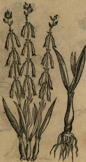
IOANNIS TERRENTII LYNCEI