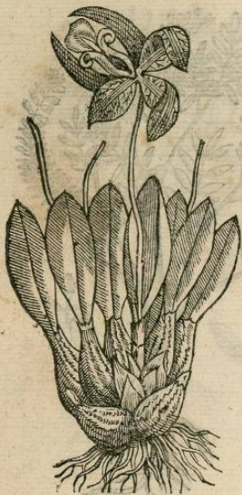
IOANNIS TERRENTII LYNCEI