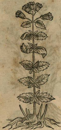
IOANNIS TERRENTII LYNCEI