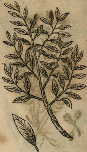
IOANNIS TERRENTII LYNCEI