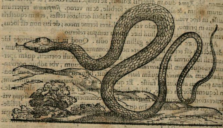
Serpens noma Hispana quadricolor.

Vertical text in the left margin, likely bleed-through from the reverse side of the page.