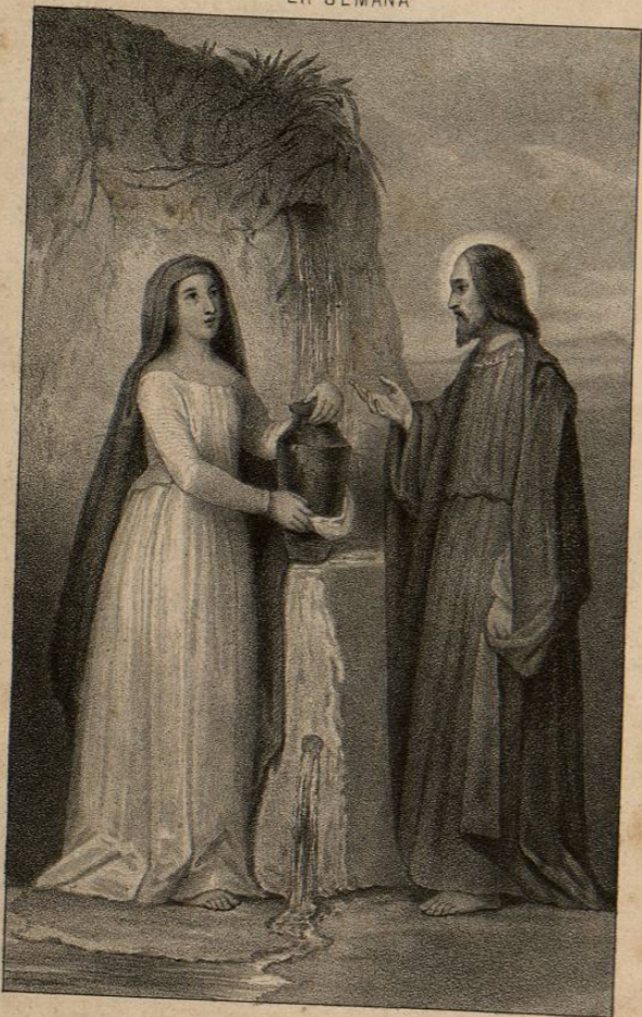
Lit. de Salazar.