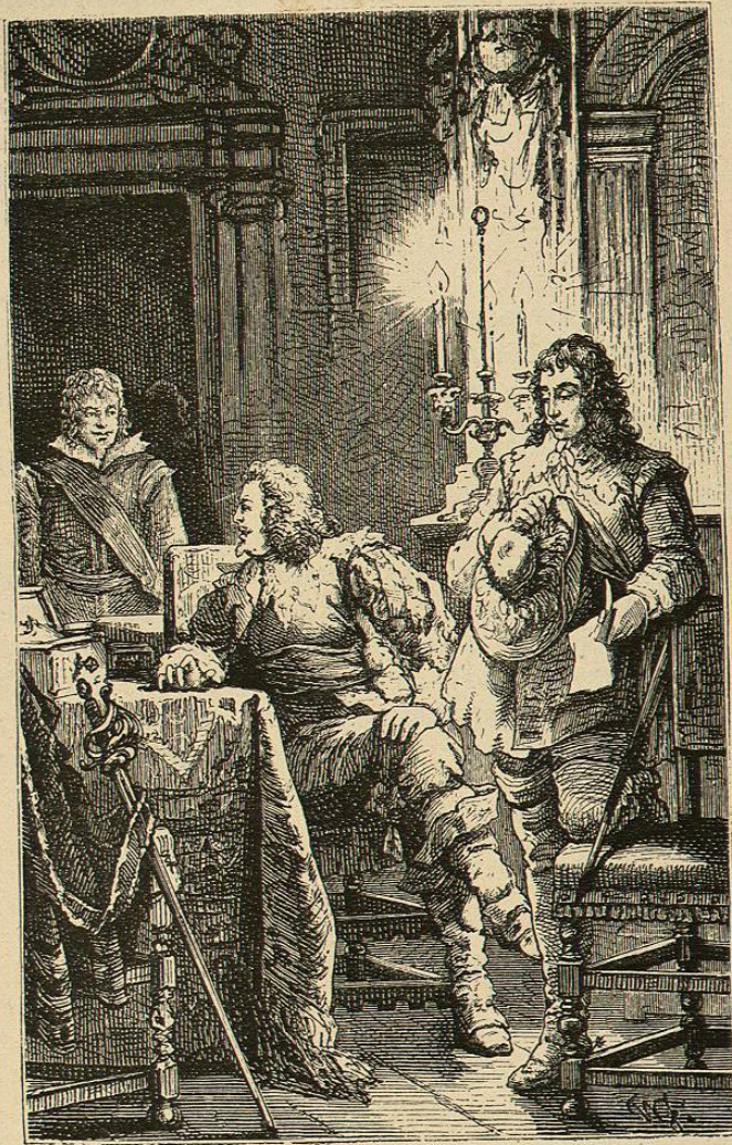
OCTAVIO.— ¿ Qué hay ?

MAX.—¿ Y á qué llamáis gestión evidente ? Ninguna