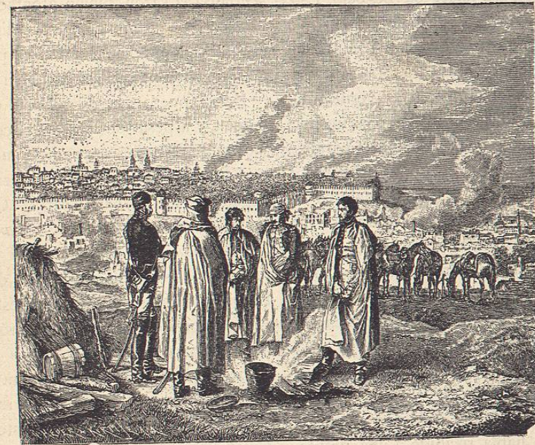
Campaña de Rusia. Vivac frente á Smolensk.—Del natural por Adam

Conforme á su estratégica propúsose desde luego Napoleon separar á los dos ejércitos atacando por Kowno por donde pasaría él mismo el Niemen, mientras lo hacían más abajo Macdonald por Tilsit