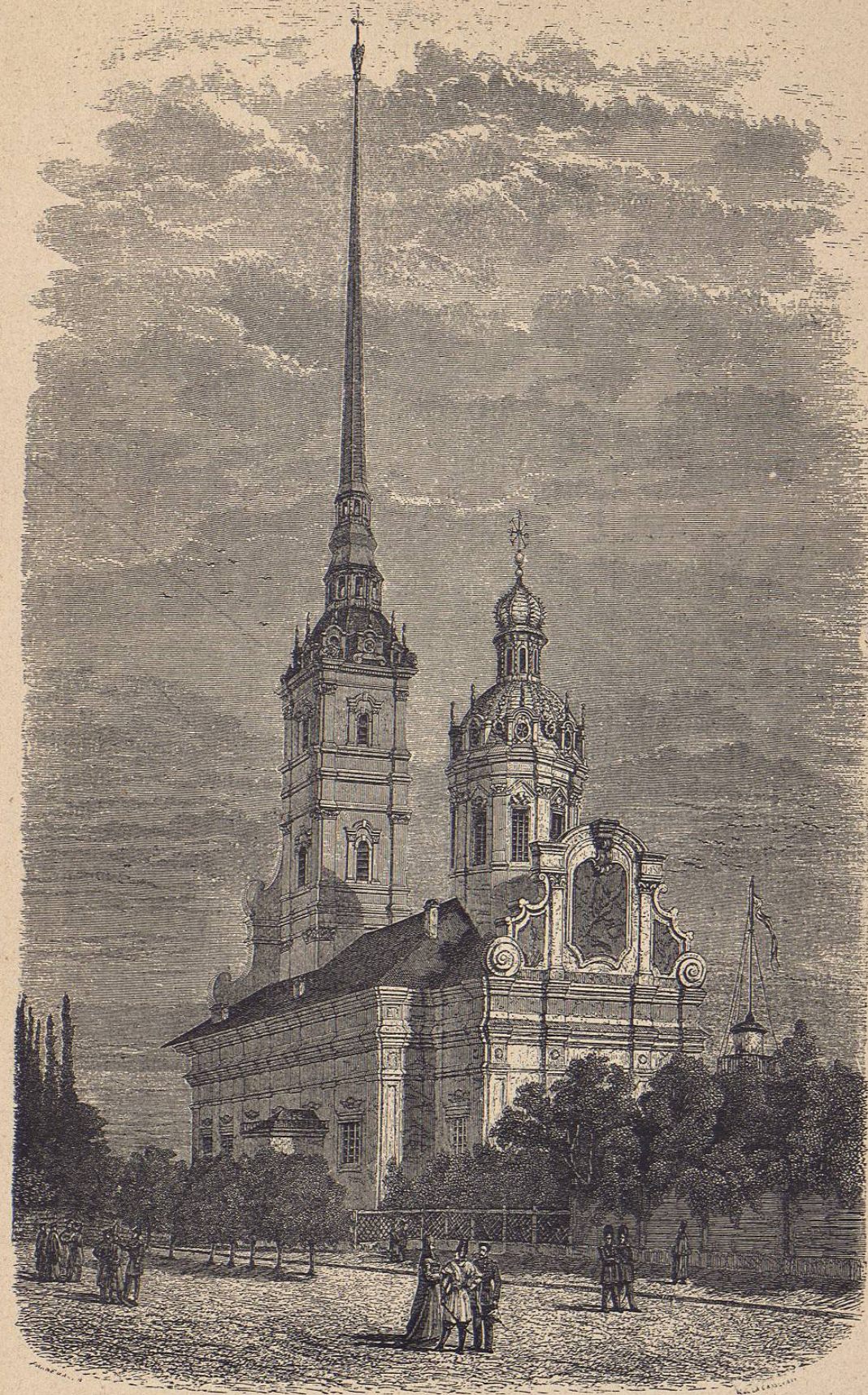
RUSIA.—Iglesia de la Fortaleza

La entrada en Wilna fué como el paso del Beresina. El hombre más inepto para mandar un ejército como el que se acercaba á sus puertas, era el que la dirigía por orden de Napoleon, este hombre era Murat. Así no hubo orden ni concierto. Se