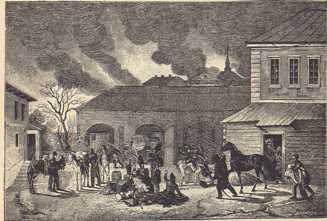
Saqueo é incendio de Moscou.

Pero era necesario salir de Wilna y de Kowno y para ello como en Smolensk iba á ser necesario combatir. ¿Quién libraría el último combate? El más valiente, y como este era Ney, Ney recibió or-