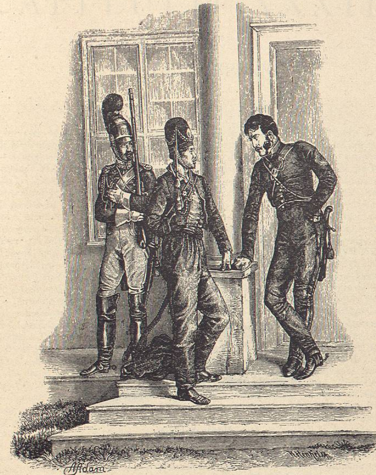
Interrogatorio de un prisionero ruso.—Del natural por Adam

sumaban dos mil cuatrocientos hombres para que no imitaran á los que llevaba Soult que se habían pasado á Wellington á condición de ser llevados á su país y haber sacado gente para formar los cuadros del nuevo ejército del Norte, se vió poco menos que encerrado en Barcelona, siendo por esta causa poco activa la guerra en Cataluña, librándose, em-