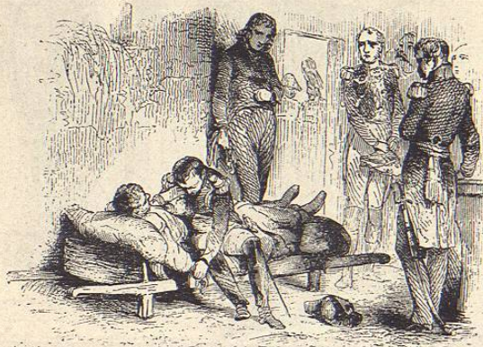
Muerte de Duroc

Augereau y Macdonald. Al fin convencidos los franceses de la imposibilidad de la conquista de Cataluña, no mantuvieron ya en ella grandes fuerzas teniendo sólo las necesarias para guardar las conquistas que habían hecho. Y á pesar de todo esto, que es tan notorio, aún está de moda hablar de lo desafecta que es Cataluña por las cosas de España!