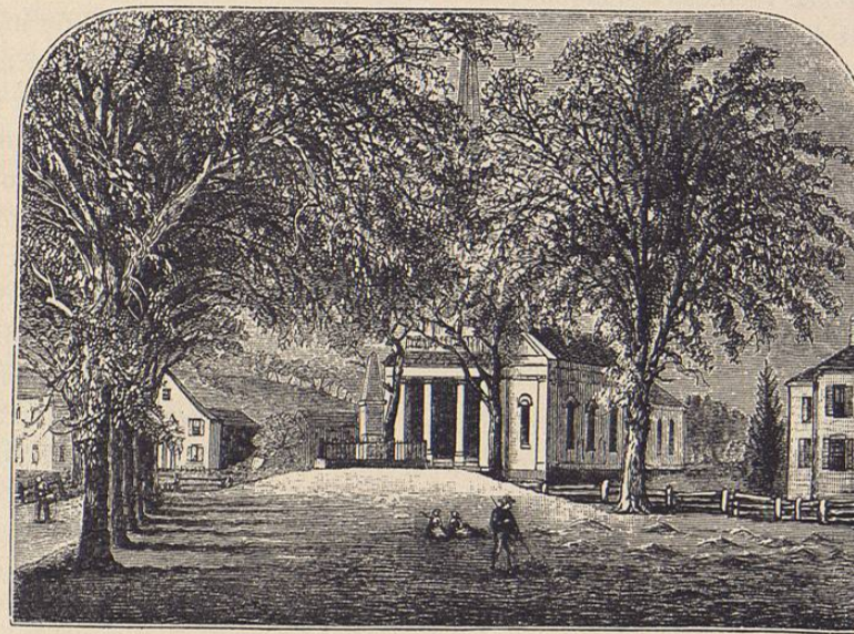
Monumento elevado sobre el campo de batalla de Lexington

Pero como los Brunswick venían algún tanto más tolerantes y liberales, y las colonias con motivo de las guerras intercoloniales prestaron grandes servicios