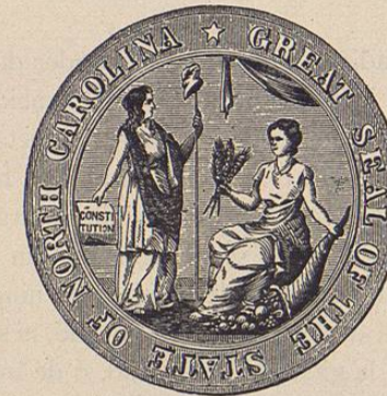
Sello del Estado de la Carolina del Norte

Hecha por consentimiento unánime de los Estados presentes, el día 17 de Setiembre del año de