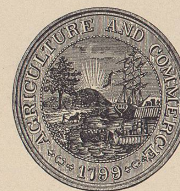
Sello del Estado de Georgia