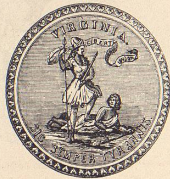
Sello del Estado de Virginia