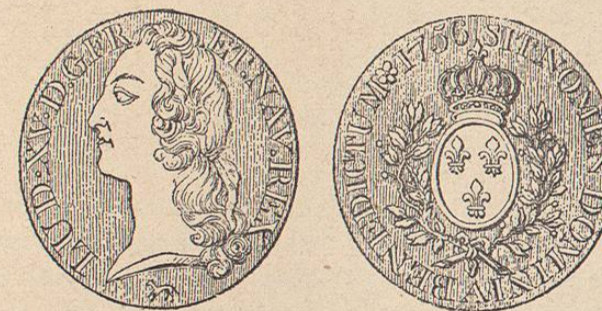
Moneda de plata de Luis XV