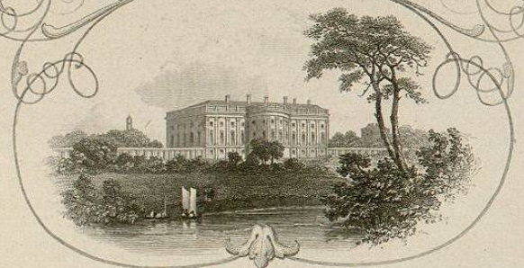
The President's House from the River.