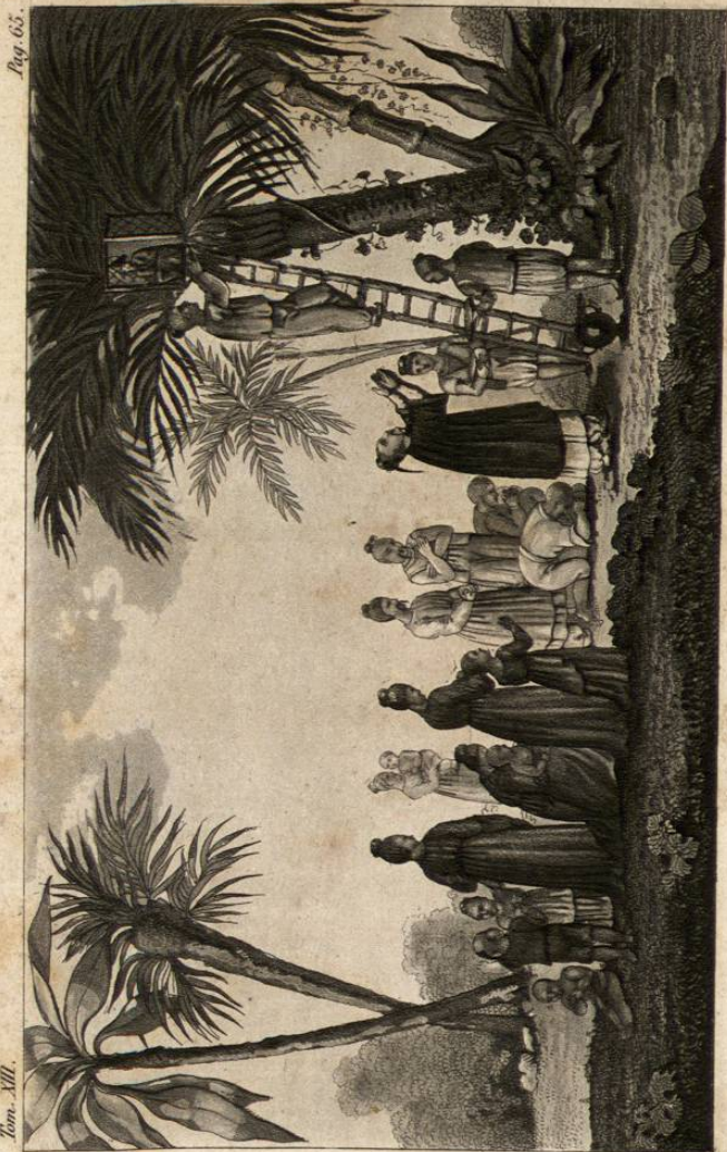
Offrande à Boudha.