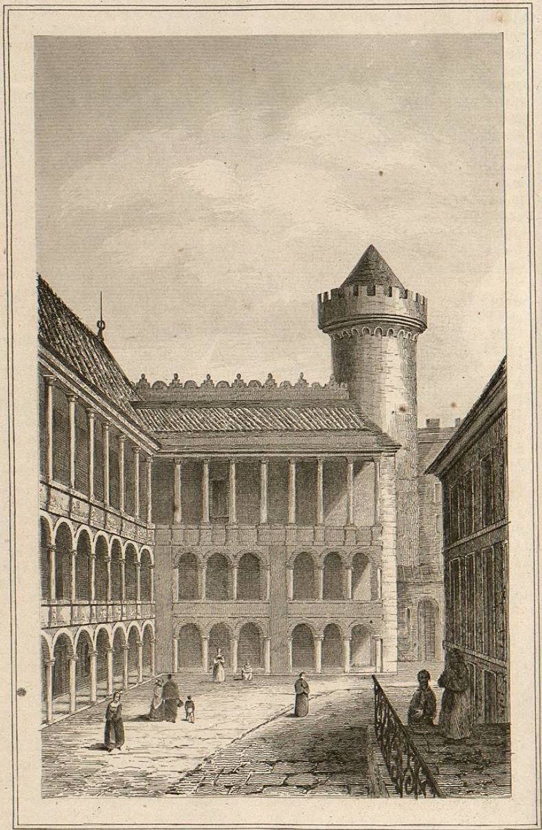
Château Royal de Cracovie. (Interieur.)