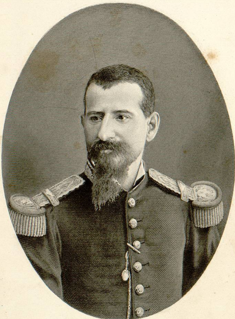
Ferd. Delannoy, sc.