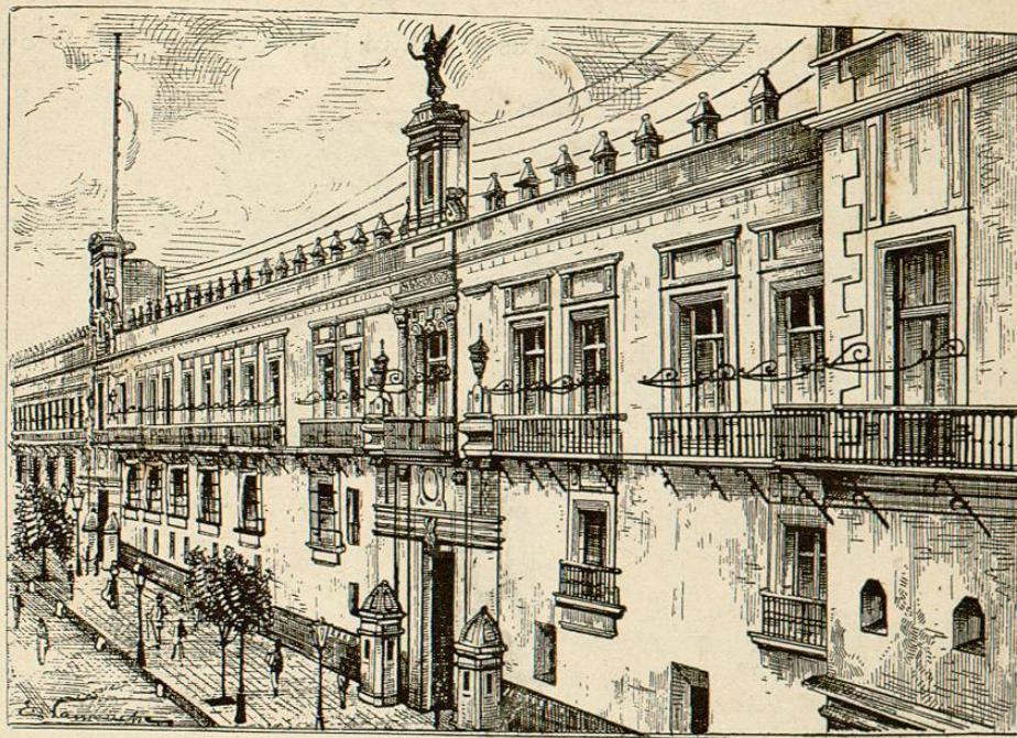
PALACIO NACIONAL DE MÉXICO.