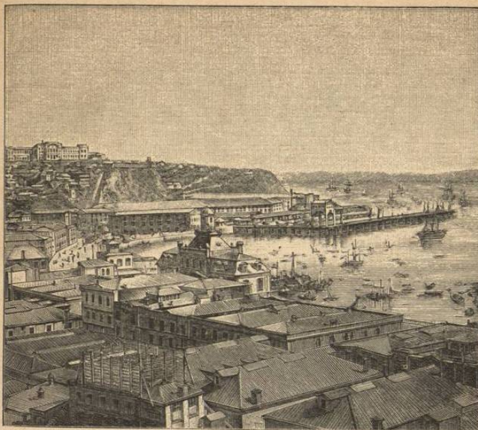
MUELLE DE VALPARAISO.