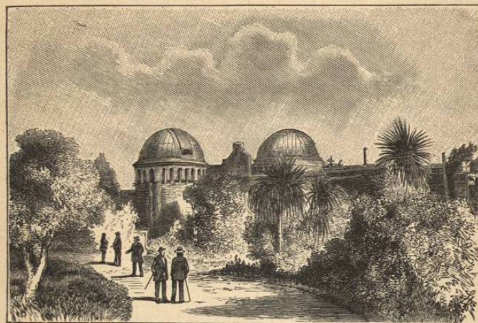
OBSERVATORIO ASTRONÓMICO. SANTIAGO.

Para la instrucción primaria funcionaron en 1898, 1368 escuelas; de éstas 678 para ambos sexos y 87 superiores. El total de alumnos matriculados alcanzó á 99,881, de los cuales 48,192 fueron hombres y 51,689 mujeres.