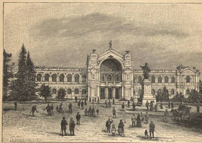
PALACIO DEL MUSEO DE HISTORIA NATURAL.

INSTRUCCIÓN PÚBLICA.—En Chile existe libertad de instrucción y cada cual puede dar y recibir la que le parezca mejor, con tal de que no sea adversa á la moralidad ó á la seguridad del Estado. Mas, para obtener grados ó para entrar en la Universidad, se necesita rendir exámenes ante comisiones oficiales nombradas por el Consejo Superior de Instrucción Pública. Este Consejo reside en Santiago, y se compone de 14 miembros, entre los que figura