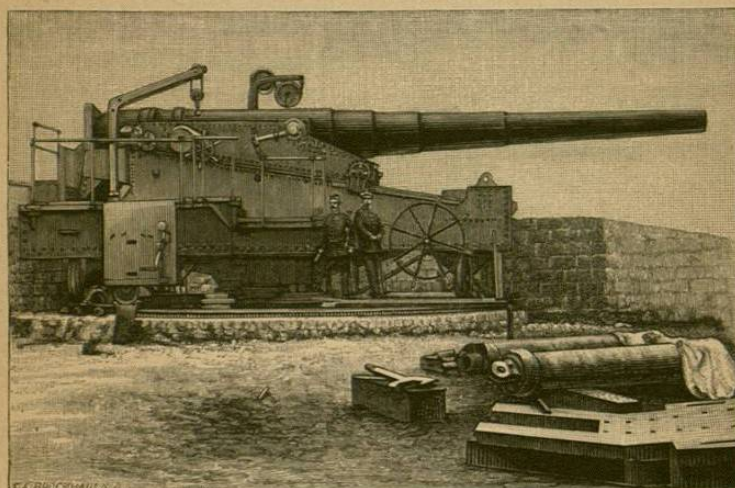
FUERTE VERGARA. VALPARAISO.

MARINA. —La marina de Chile es una de las más fuertes y mejor organizadas de América del Sur. Se compone de 9 cruceros, de los cuales los mayores son el "O'Higgins" de 8,500 toneladas; el "Capitan Prat" de 6,966 toneladas; la "Esmeralda" de 7030 toneladas; el "Cochrane" de 3550 toneladas. A estos buques de combate, más ó menos