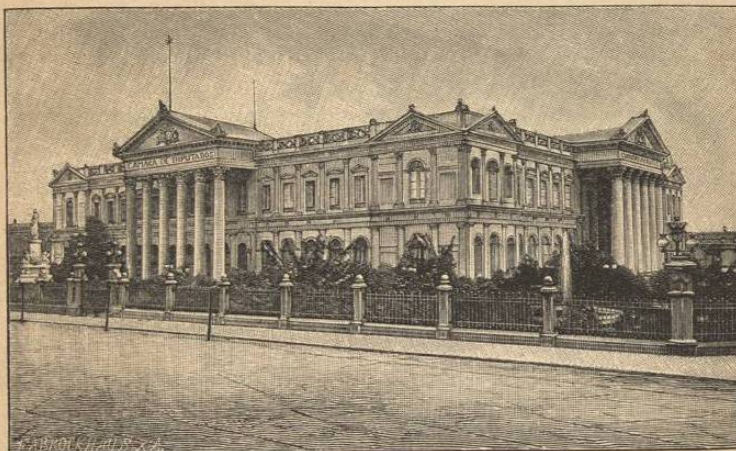
PALACIO DEL CONGRESO NACIONAL. SANTIAGO.

LEYES POLÍTICAS.—No hay clases privilegiadas en Chile, y todos son iguales ante la ley. Hay una sola justicia, excepto la militar, instituida ésta para delitos puramente militares. Queda garantizada la libertad y seguridad de las personas y de la hacienda. Nadie puede ser apresado sinó con una orden judicial, excepto el caso de delito en fragante. Se goza igualmente de absoluta libertad para