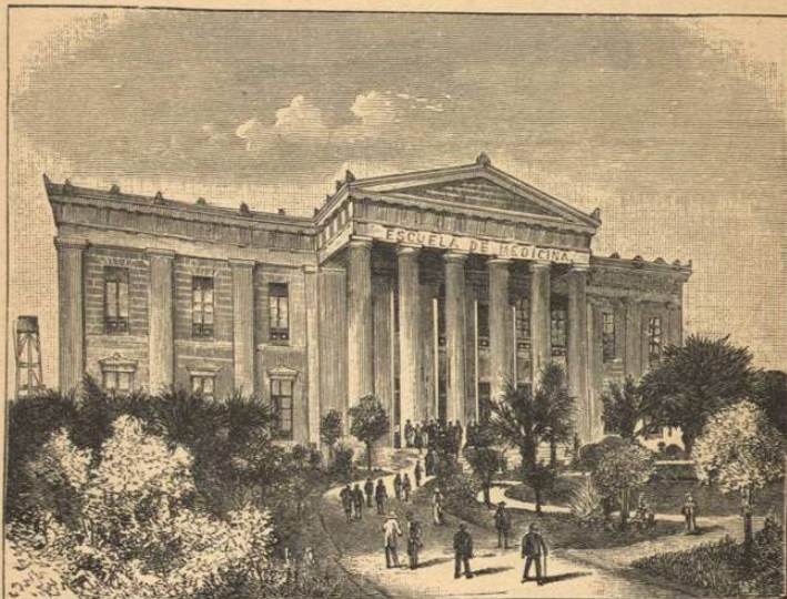
ESCUELA DE MEDICINA. SANTIAGO.

Para la instrucción secundaria existe el Instituto Nacional en Santiago, frecuentado por numerosísimos alumnos, no sólo de Chile sino también de otros países de la América latina. Este Instituto fué fundado en los primeros tiempos de la independencia de Chile. En todas las capi-