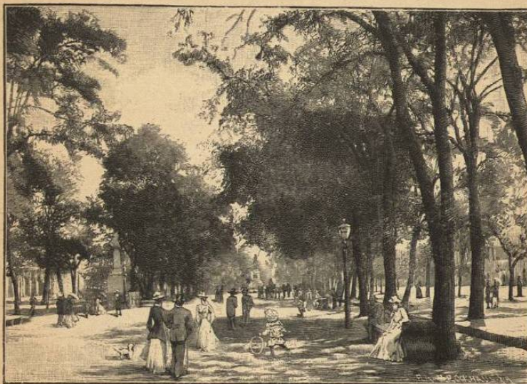
ALAMEDA DE SANTIAGO.

No nós es posible entrar en muchos detalles acerca de la rica flora de la zona central, cuyo clima es casi igual al del norte de Italia, sin los extremos de temperatura que son más moderados en Chile. Entre los árboles útiles, mencionaremos: el quillai ( Quillaya saponaria ), cuya cor-