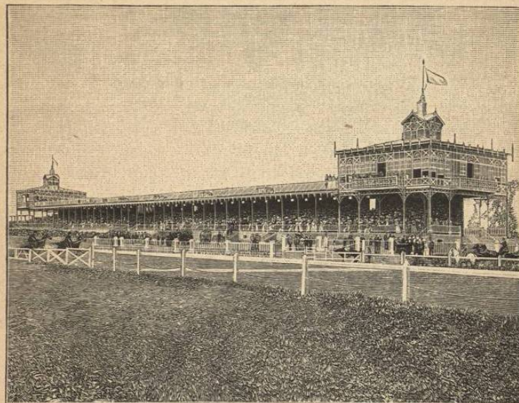
CLUB HÍPICO DE SANTIAGO.

dicho ganado tanto por su excelente carne como por la lana de primera calidad que de él se obtiene. El ganado en Chile, con excepción de algunas vacas lecheras de clase privilegiada, pastorea todo el año en potreros abiertos, de día y de noche, permitiendo ésto la benignidad del clima. Las lecherías se han mejorado considerablemente en los últimos años, habiéndose vendido en 1898, desde los puertos chilenos á las Repúblicas vecinas ó á buques que hacen