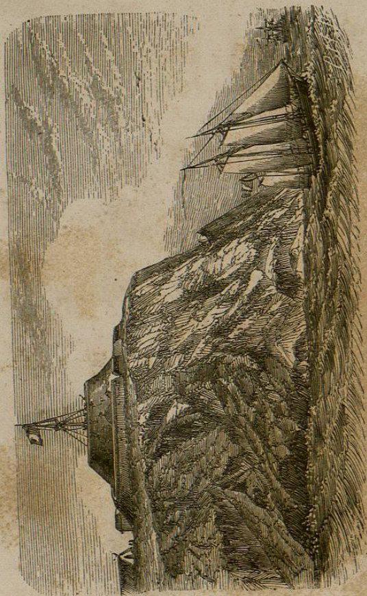
MAR DE AZOF.