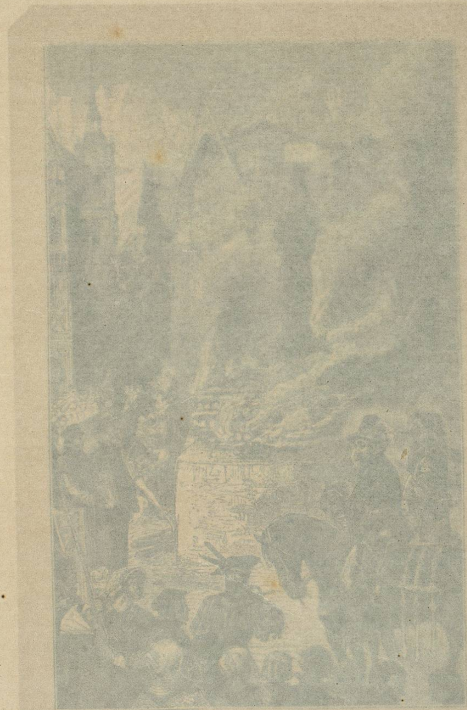
Sepelio del español Miguel Servet, quemado vivo en Ginebra el 27 de Octubre de 1553.

Algunos autores como Isidro Geoffroy-Saint-Hilaire y Flourens, han querido atribuir á Cesalpino no solamente la descripcion de la circulacion pulmonar, sino aún la de la grande circulacion. Las pruebas que se aducen en apoyo de dicha opinion no parecen suficientes para quitar á Guillermo Harvey su mejor