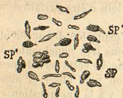
FIG. 56. — Spores des bacilles de la diphthérie, d'après Cornil et Babès.

Certains milieux semblent plus particulièrement favorables au développement du germe diphthérique; parmi eux, les fumiers et les détritiques du balayage des villes occupent la première place (Klebs, Teissier, Ferrand, Longuet); et les poussières qui en émanent sont très vraisemblablement une des causes de propagation les plus efficaces de la maladie (40 fois pour 100, J. Teissier). Les expériences de Lœffler ont montré d'ailleurs que le bacille diphthérique