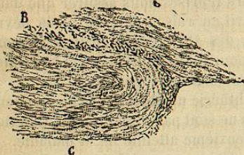
FIG. 57. — Fausse membrane diphthéritique avec colonies de bacilles interposées entre deux couches de fibrine. — C, couche de fibrine d'aspect lamelleux; B, bactéries.

Les fausses membranes, blanchâtres ou grisâtres, presque toujours irrégulières, en gé-