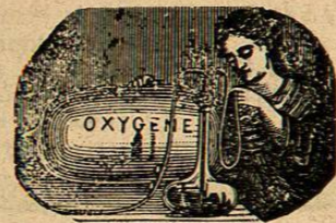
(Grabado 2) Aparato inhalador LIMOUSIN de gas oxígeno

Las inhalaciones de oxígeno están indicadas para combatir la asfixia, anemia, ciertas formas de tisis, la dispepsia, la diabetes, cólera y los vómitos incoercibles del embarazo.