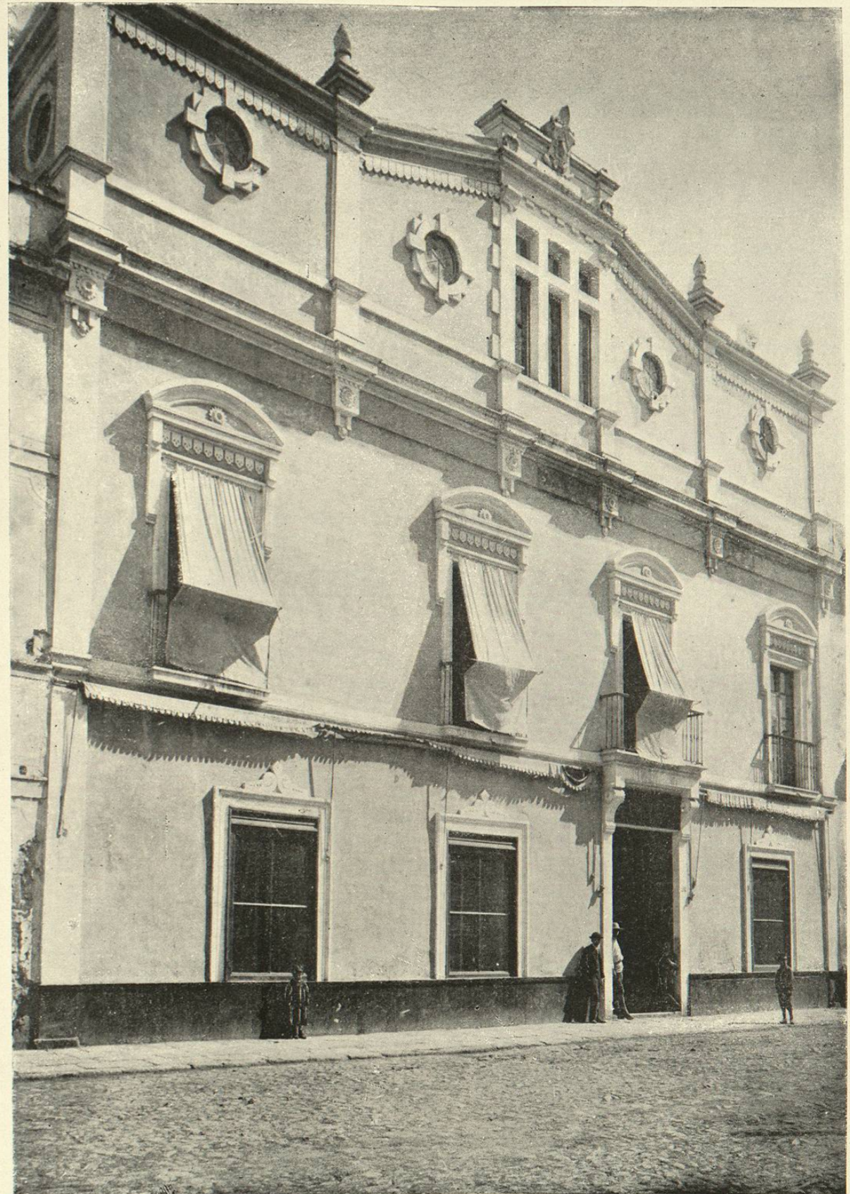
Escuela N. de Artes y Oficios para Mujeres.

El número de alumnas inscritas en el último decenio es 5,776. En el mismo tiempo salieron de la Escuela después de terminar sus respectivos cursos 115.