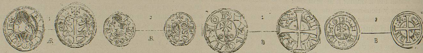
ALFONSO II DE ARAGON Y I DE BARCELONA

continuadas guerras, aconsejados tambien por los prelados y ricos-hombres amantes de la paz, acordaron someter sus diferencias á la decision arbitral del rey Enrique II de Inglaterra, suegro del de Castilla, obligándose á respetar su fallo, dándose mutuamente en fiabilidad, que se decia, cuatro castillos de la pertenencia de cada uno para seguridad del cumplimiento de aquel convenio, y estableciendo bajo su fe